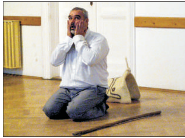
A bot