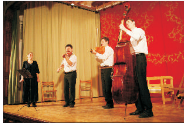
Figurás Népzenei Együttes

A délutáni játszóházat sok óvodás és iskolás gyermek kereste föl, ahol elmélyedhettek különböző kézműves tudományokban. Kipróbálhatták magukat az ifjoncok a borművészetben, korongozásban, gyékényjáték és csuhébáb készítésben, sólisztgyurmázásban, karácsonyi díszek készítésében. A gyerekek a Parázs Hagymányozó Egyesület tagjainak és a hatvani Grassalkovich Alapítványi Szakiskola tanárainak segítségével készíthették el műveiket. Az alkotás szüneteiben vajás kenyér és meleg tea várta a kis művészeket.