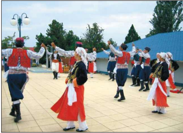
Színvonalas műsor a strandon

Az észak-ciprusi együttes 2001-ben alakult és jelenleg 5 csoporttal működik. Fő