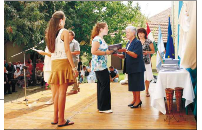
A Hazánk titkai pályázat eredményhirdetése