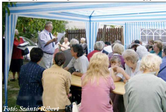
Fotó: Szántó Róbert