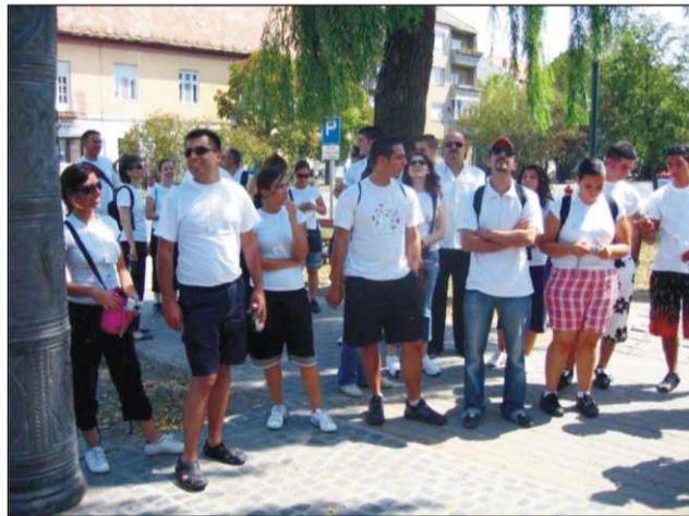
A városközpontban ...