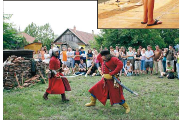
Nagy érdeklődéssel nézték a párbajt

A helyi tábor programját városunk önkormányzata mellett egy sikeres Európai Unió pályázat is támogatta.