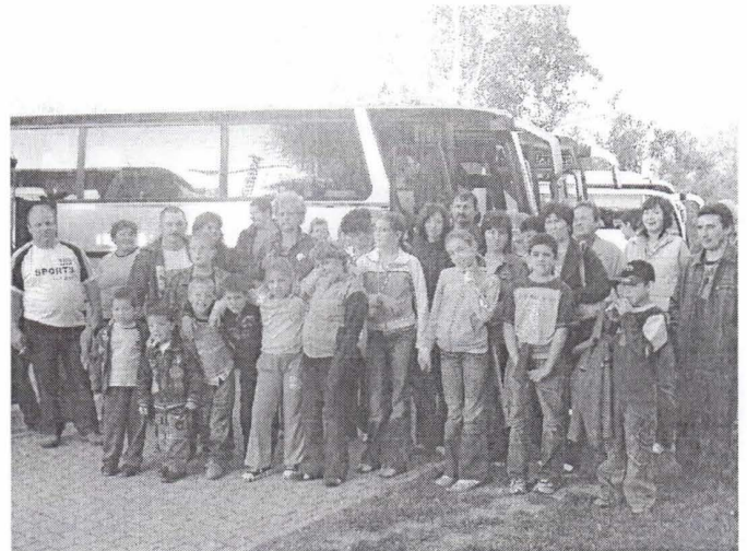
Október 14-én Budapest környéke: Egynapos kirándulás a „közepű” nagy csoport részére.

Október 7-én Eger és környéke: Klub kirándulás elsősorban azon klub-tagok részére, akik segítettek a bál szervezésében és lebonyolításában.