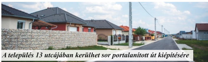
A település 13 utcájában kerülhet sor portalanított út kiépítésére

Bordány Nagyközség Önkormányzata az elmúlt években zajló csatornázási és ivóvízminőség-javító munkálatokkal egyidejűleg folyamatos előkészítő munkát végzett azzal kapcsolatban, hogy szilárd útburkolattal nem rendelkező utcákban is a következő években megindulhasson egy helyi szintű, a lakosság együttműködésével megvalósuló útépítési program. A projekt megvalósításához önkormányzati forrás mellett pályázati forrásra, és lakossági befizetésre is szükség lesz, ezért most, hogy a szennyvíz-beruházás sikeres lebonyolításának köszönhetően jelentős pénzmaradvány keletkezett, melyet a bordányi családok hamarosan megkapnak az önkormányzat újabb fejlesztést szeretne indítani.