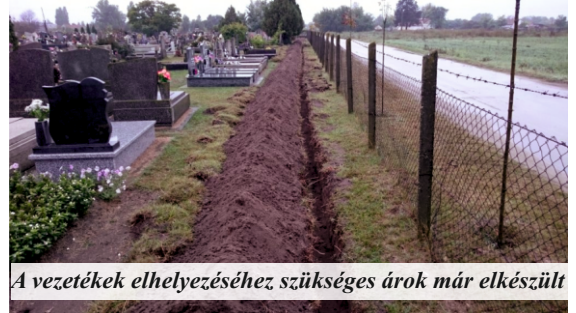
A vezetékek elhelyezéséhez szükséges árok már elkészült

Bordány Nagyközség Önkormányzatának képviselő-testülete még nyáron döntött úgy, hogy az időszakosan előforduló sírlopások, vagy rongálások megelőzése érdekében egy több kamerából álló rendszert épít ki a bordányi temetőben. A tervezési és előkészítési szakasz lezárult, a tényleges munkálatok pedig már múlt héten megkezdődtek. Először a vezetékek elhelyezéséhez szükséges árok kiásása történt meg, de ezzel párhuzamosan már folyamatosan készülnek azok az oszlopok, melyek a temető több pontján kerülnek kihelyezésre. A cél az, hogy az október végétől a temetőbe érkező megemlékezők már biztonságosan, a fentebb említett kellemetlenségektől mentesen tudjanak családjukkal kilátogatni szeretteikhez. Az önkormányzat a kivitelezési munkálatok alatt kéri a lakosság türelmét, együttműködését, hiszen közös érdek, hogy a beruházás megvalósuljon. A kamerarendszer kiépítésével egyidejűleg új parkolási és forgalomirányítási rend is életbe lép a bordányi temetőnél. A Petőfi utcáról kiérkezve az első kapunál behajtani tilos tábla kerül kihelyezésre, a megemlékezőknek a második, ravatalozóhoz közelebbi kapunál lesz ezentúl lehetőségük bejutni a területre. A cél az, hogy könnyebben lehessen közlekedni a temető környékén Mindenszentek és a Halottak Napja alkalmával is. Szintén fontos új információ, hogy parkolni a ravatalozó melletti üres területen lesz célszerű, amellyel könnyebben elkerülhetőek lesznek az esetleges torlódások és fennakadások.