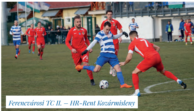
Ferencvárosi TC II. – HR-Rent Kozármisleny