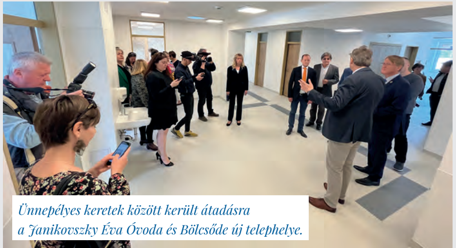
Ünnepélyes keretek között került átadásra a Janikovszky Éva Óvoda és Bölcsőde új telephelye.

Nagyon fontos pillanat volt márciusban, hogy elkészült az új, négy-csoportos bölcsődeépület a Fészek lakóparkban. Ezzel ez sokéves projektnek érkeztünk el egy fontos mérföldkövéhez, hiszen még 2016