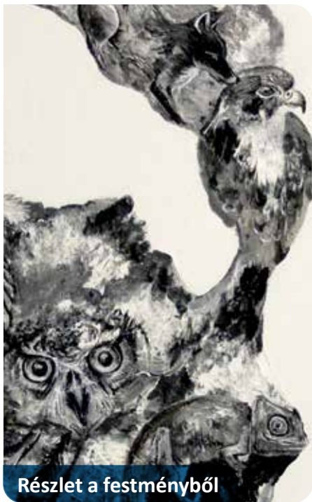
Részlet a festményből