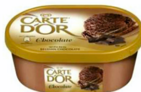
Carte D'or jégkrém chocolate 1000 ml