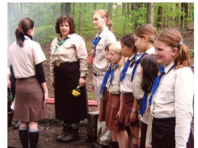
Őrs avatás zöldnyakkendősné, 2000.