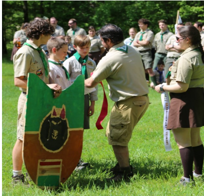
14. cscs. Fekete párduc őrs, első hely.

Azt mondják, ami késik, nem múlik. Ez igaznak bizonyult sok mindenre az elmúlt két év alatt, és szintén igaznak bizonyult a cserkészév egyik