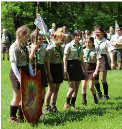
34. lcs. Paprika őrs, első hely.