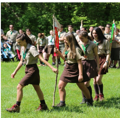
34. lcs. Vadvirág őrs, első hely.