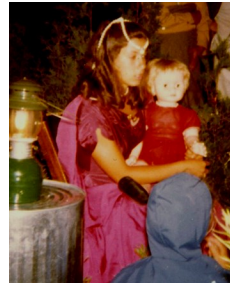
42. lcs. torontói kcs. táborban Gizella királynő mesél, 1970.

néhány év múlva Clevelandba költöztek. Ez az időszak nem a cserkésztől szólt, az anyaságra, kicsi gyermekei nevelésére koncentrált. Amikor 1988-ban elindították az óvodáskorú fiúknak szóló cserkészetet, végre kapcsolódni tudott a közösséghez, mert fiait elvitte foglalkozásra. A hivatalos visszatérése a mozgalomhoz