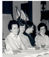
Szervező testület elnök, kb.1968.