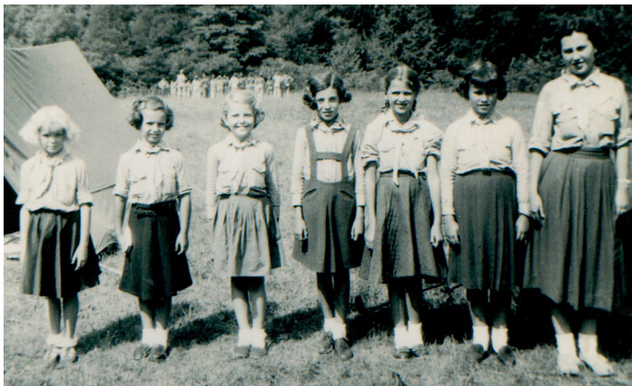
A Búzavirág őrsben néha kilenc gyerekekkel is dolgozott mint őv., 1953.