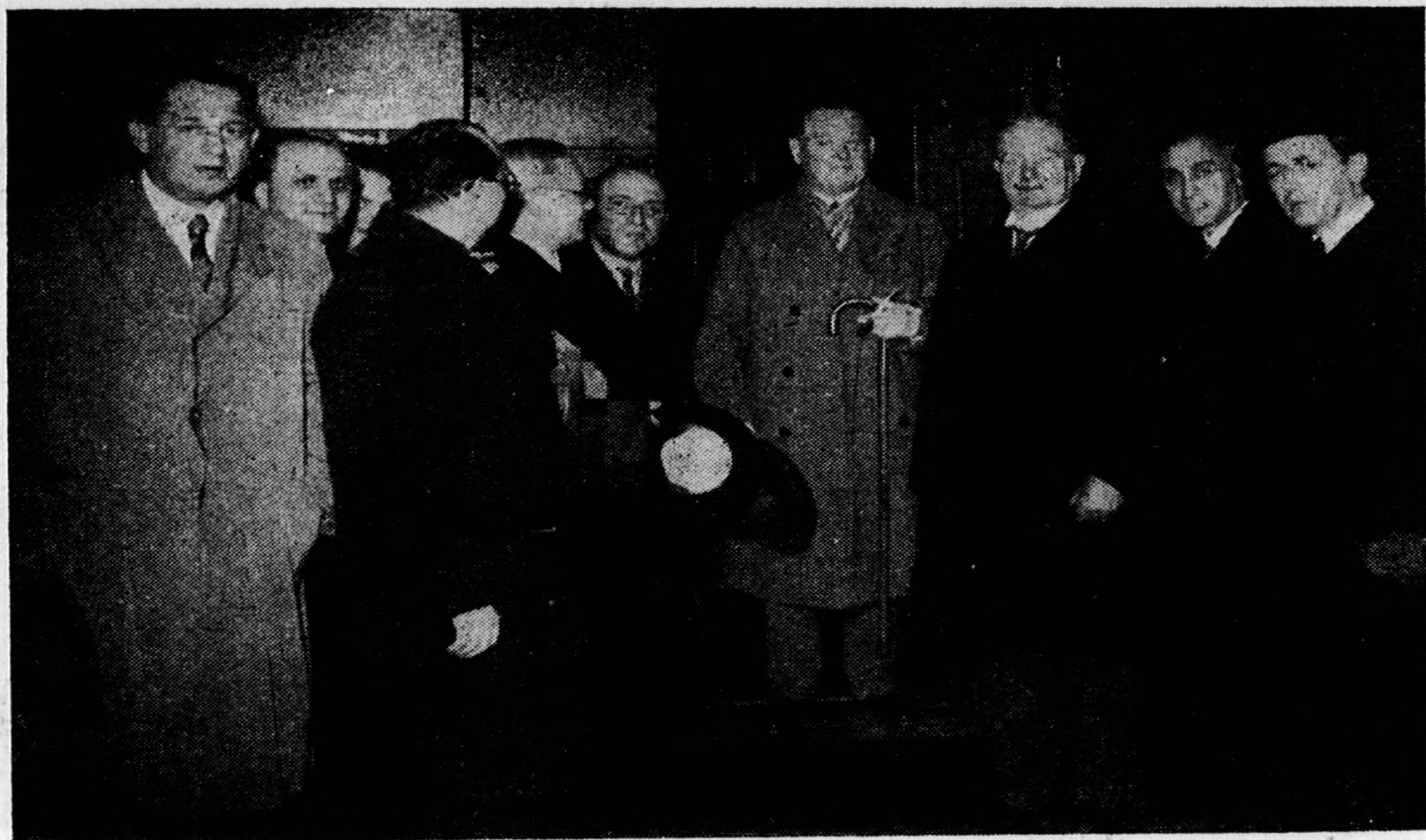
Mengelberg fogadtatása a Keleti p. u.-on.