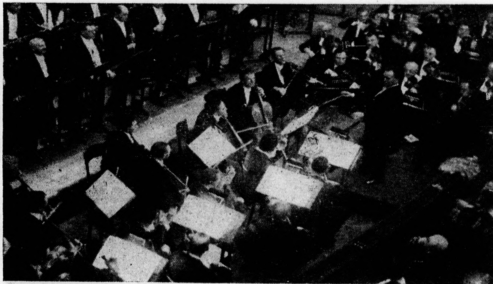
Hangverseny a Városi Színházban.