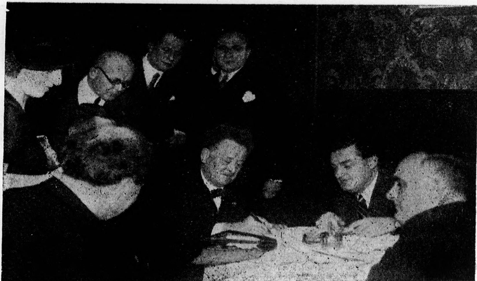
Mengelberg autogrammot ad.

— Természetesen. Hiszen már a régi hollandi festők művein látható, mennyire rajong a holland nép a zenéért. De muzsikája annyira sajátos, karakteres és primitív, hogy nem válhatott olyan internacionálissá, mint például a magyarok cigánymuzsikája.