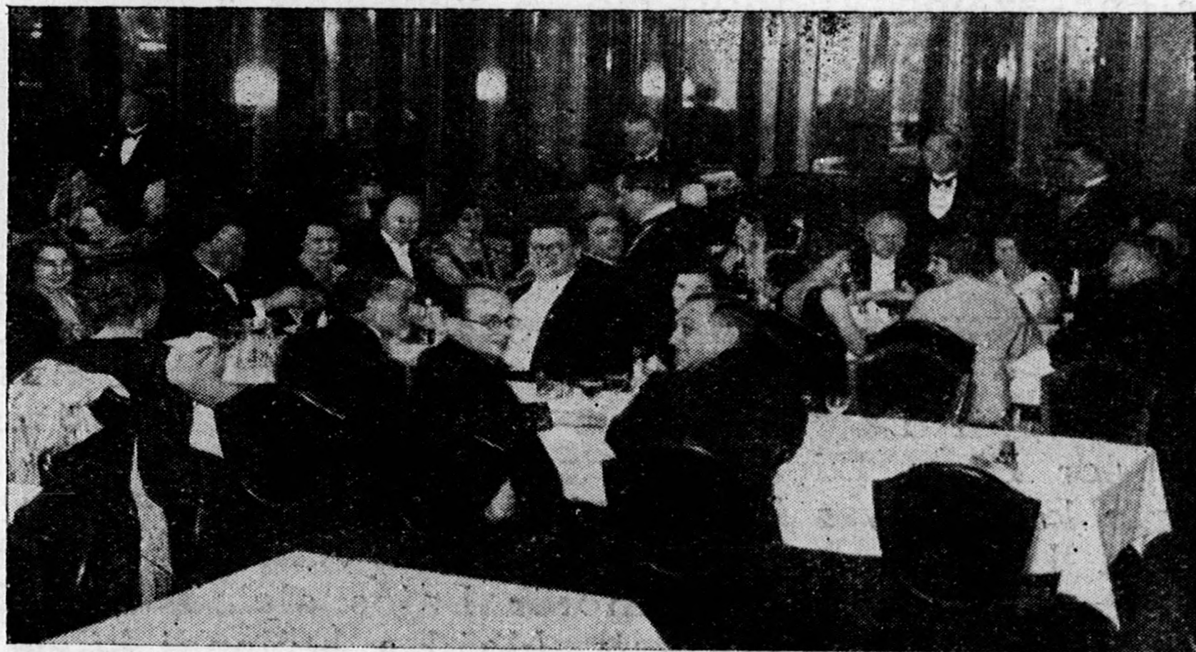
Bankett a Newyorkban.

— Nem hiába vágytam az évek hosszú során át Budapest után, a magyar főváros nagyon kellemes hatással volt reám. Februárban, mikor Mahler „Lied von der Erde“-jét vezényelem Bécsben, újra ellátogatok Budapestre. Igen örültem, hogy a magyar zeneélet vezetőivel is megismerkedhettem, de legnagyobb élmény volt számomra a pompás magyar filharmonikus zenekar. Ugy érzem, hogy a Városi Színházban komoly sikerünk volt. A zenekar nagyszerűen követett. Szívvel-lélekkel együtt éreztem magyar zenésztársaimmal és örülök, hogy ezt a szép estét a rádió keresztül Hollandiában, honfitársaim is hallhatták.