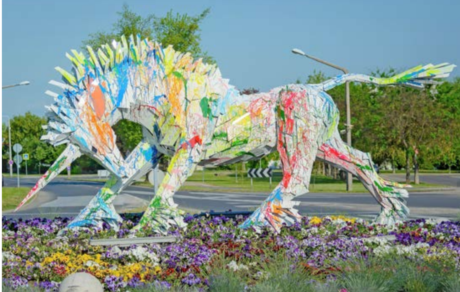
Tour de Hongrie Kazincbarcika