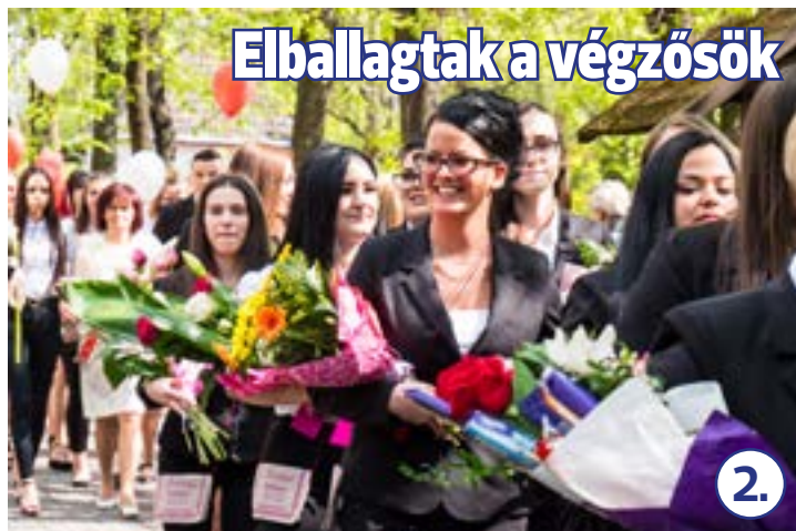
Elballagtak a végzősök