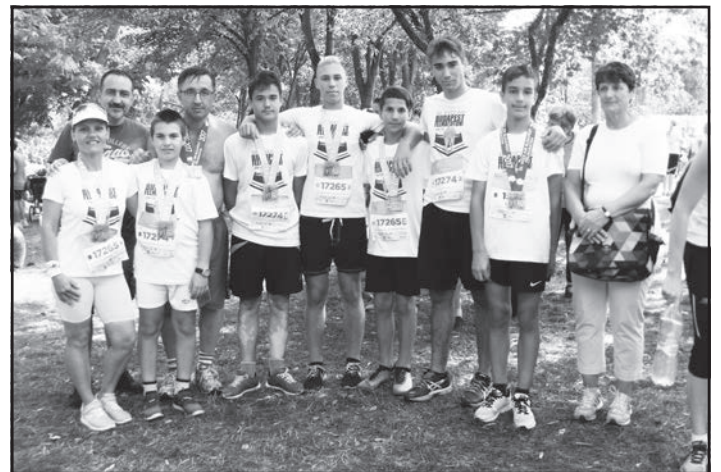
A kocséri futócsapat

Több mint 70 országból érkeztek résztvevők, összesen több mint 15 000 futó indult el a versenyen.