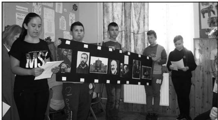
Szent Pió atya életútja – a 7.-esek előadásában