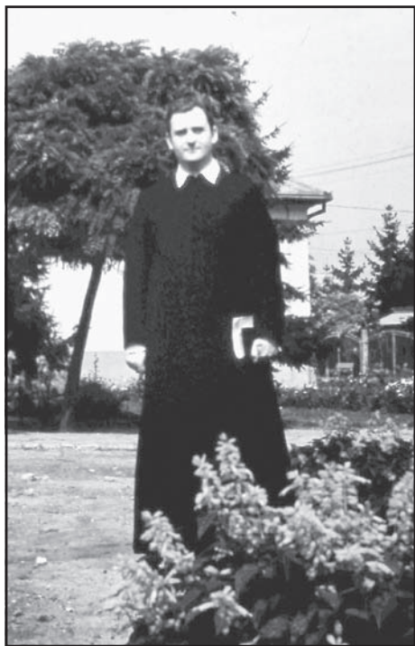
A templomkertben 1977-ben

A kocséri lelkekért végzett szolgálatát, az eltelt négy évtized tevékeny és gyümölcsöző időszakát