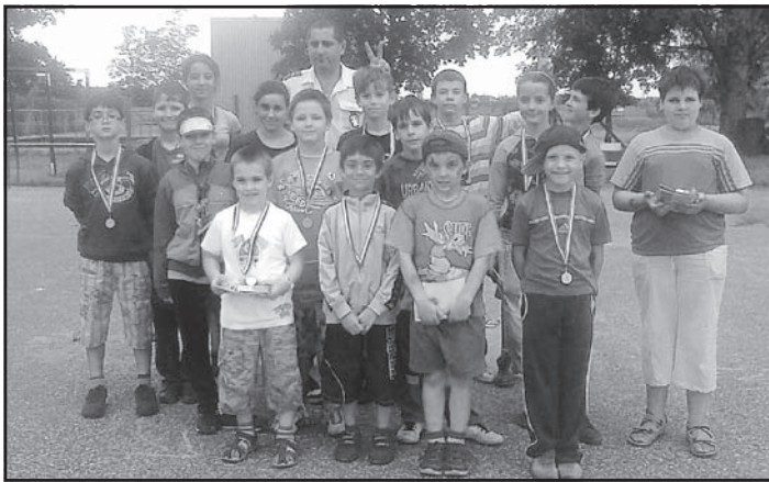
A kreszverseny díjazottjai

Délután a kreszverseny volt a legnagyobb attrakció, de azért a rendőrség kutyás bemutatója is emlékezetes marad!