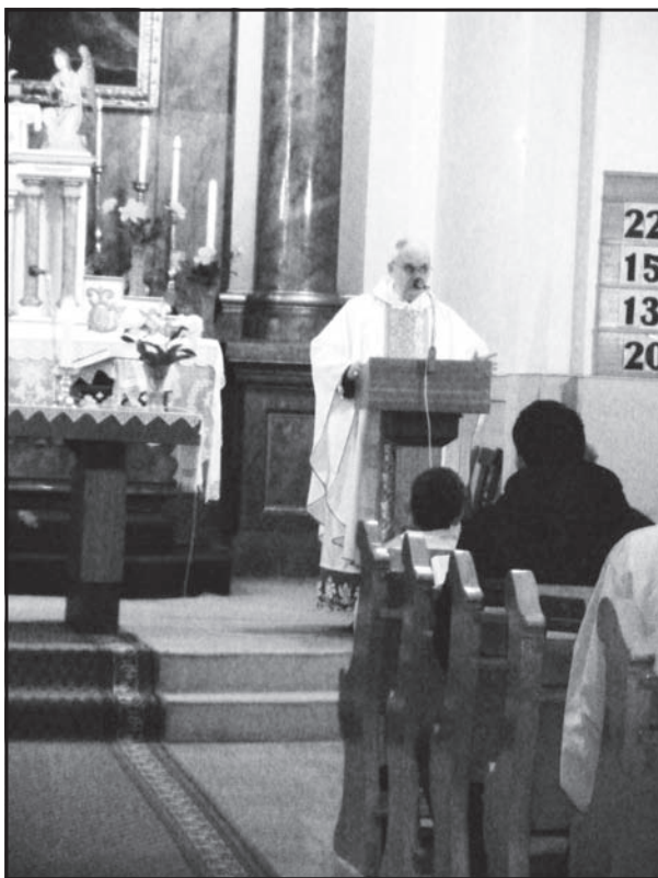
Híveitől búcsúzik 2012. május 12-én

2010-ben aranymiséjén köszönték meg Neki.