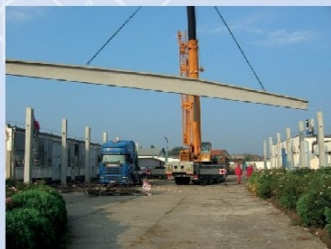
A betongerendák pillérekre történő elhelyezésének kezdete (2011)

Addigra akkora lett a társaság képességeire az igény, hogy szükségessé vált a régi gyár még nem használt területeinek gyártásba történő bevonására.