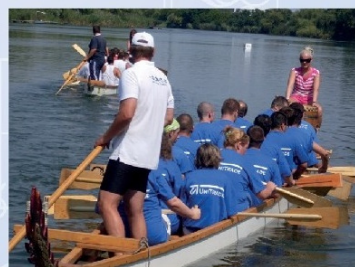
Csapatépítő sárkányhajózás (2009)

Az új nagy vevő folyamatosan bővülő igényei kiszolgálásához növelni kellett a társaság kapacitásait. Ezek mellett maradt azért idő új csapatépítő szabadidős kikapcsolódásokra. Egy ilyen csapatépítésen kedvelték meg a sárkányhajózást, ahol pont úgy, mint a társaságnál, minden csapattagra szükség van és fontos, hogy közöttük összhang legyen. Itt meg kellett tanulniuk, hogy a hajójuk csak akkor siklik gyorsan és harmonikusan a vízben, ha mindenki egyszerre evez.