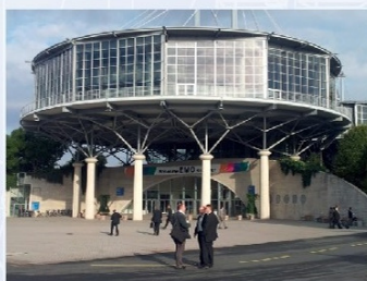
EMO (Hannover, 2011)

Az új vevői igényekhez új technológiák is társultak. Ilyenek voltak többek között a mángorlás és a hőkezelés. Ezzel kapcsolat kínálta megismerésére a legjobb lehetőséget továbbra is a már említett EMO kiállítás jelentette. Így műszaki csapatuk meglátogatta azt Hannoverben.