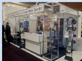
Első külföldi kiállítás: ELMIA (Svédország | Jönköping | 2011)

A külföldi kiállításoknak köszönhetően 2009-től napjainkig is folyamatosan nő a vállalkozásuk exportja.