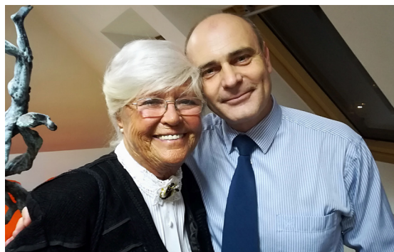
Egy személyes kép a búcsúzótl: Tavalyelőtt novemberben, a Márton esti muzsika rendezvényünk után, elköszönés előtt.