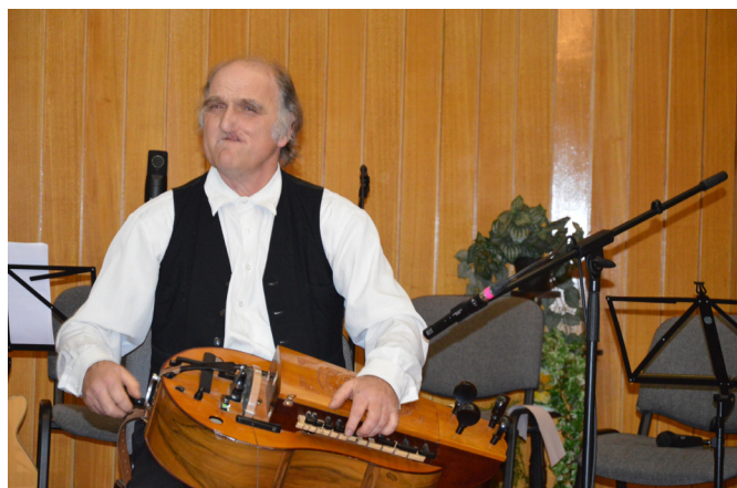
A Magyar Kultúra Napja - beszámoló a 2-3.oldalon