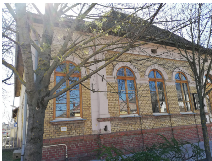
Üri Kaszinóból étterem - részletek az 5. oldalon