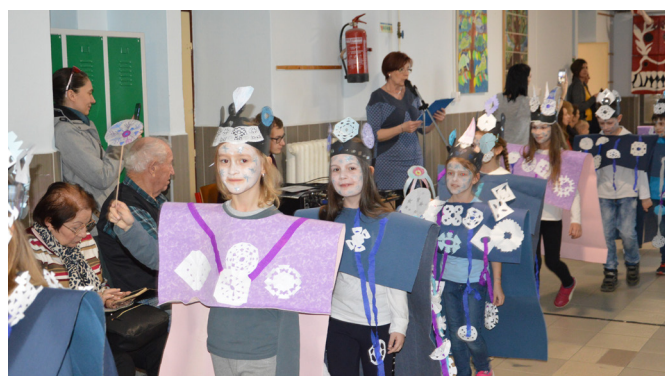
Rajziskolai farsang és télbúcsúztató összefoglaló a 15. oldalon