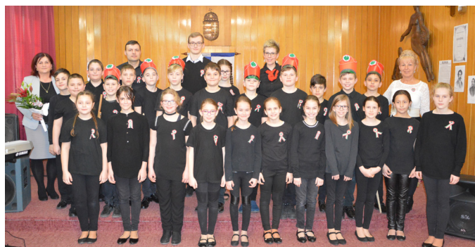
Emlékezés az 1848/1849-es forradalomra és szabadságharcra - részletek a 3. oldalon