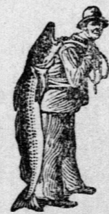
Az Emulsió vásárlásánál a SCOTT-féle módszer védjegyét — a halászt — kérjük figyelembe venni