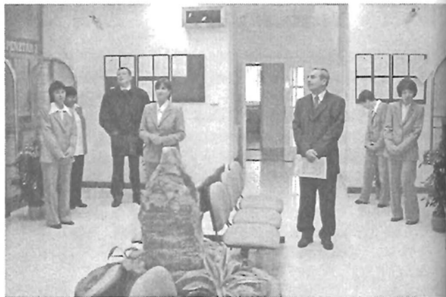
Az új kirendeltség átadásán, Gyomán

– Erre nehéz válaszolni, hiszen csak egy okot nem tudok megjelöl-