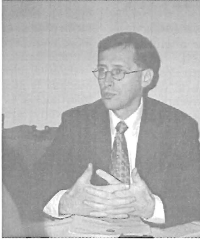
Varga Mihály pénzügyminiszter a Fidesz alelnöke

Járulékok esetében '98-ban elindítottuk a járulékcsoökkentéseket 39-ről 33%-ra. Az idén is, jövőre is tovább csökkentjük 2-2%-kal. A kis- és középvál-