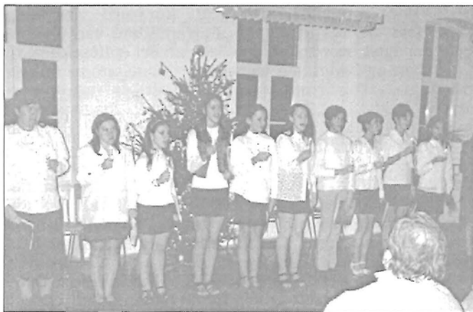
A gyertyás köszöntő

Karácsonyi hangversenyt tartottak a Kiseréti utcai Zeneiskolában december 17-én, a növendékek fellépésével. Mintegy 34 műsorszám szórakoztatta a megjelent szülőket, érdeklődőket.