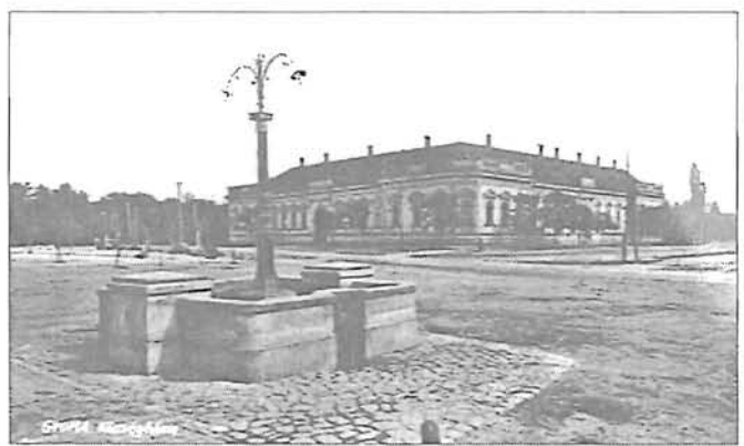
Gyomai főter a 30-as években