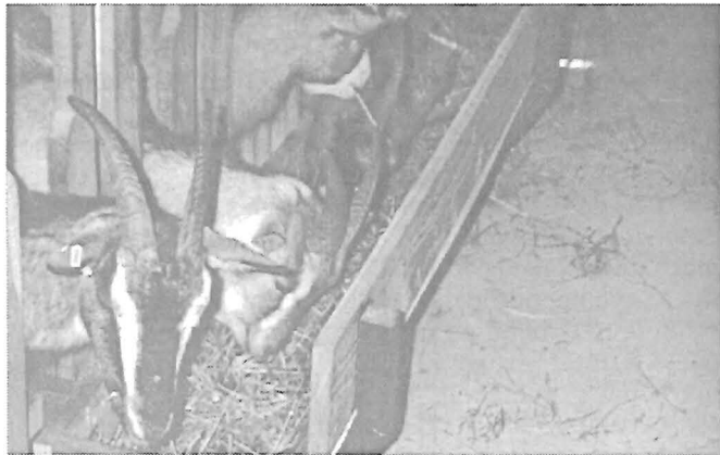
A kecskék az istállóban