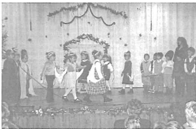
A Tulipános óvoda Betlehemes játéka a Dérynében

Január 1-én és 2-án fedezték fel, hogy betörték egy-egy Sóczó-zugi hétfégi házba. Mikrószűt, porszívót, valamint hosszabbítókábel, gumimatraccot, faliórát loptak el belőlük a még ismeretlen betörők.