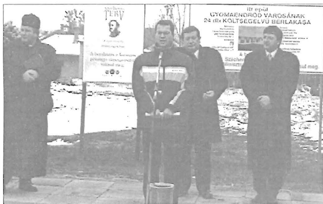
Endrődi utcában a 24 lakás alapkövét...

A fiataloknak szánt 70 és 74 m 2 -es, nyolc darab bérlakás építése bizonyára tovább javítja majd a településen a lakhatási feltételeket, az életkezdesi esélyeket a fiatal pályakezdő házaspárok részére. Helye: a Gyoma és Endrőd közötti beépítetlen terület az Újkert soron. (Bérek: 13 351, illetve 14 025 Ft/hó/lakás.)