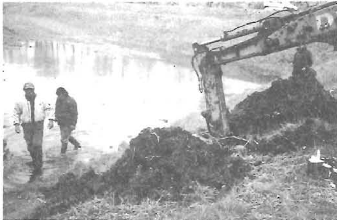
A Hantostkerti gát átvágása

teltével megkezdődött az apadás. Igaz viszont, hogy 770-780-as vízállással kb. tíz napig stagnált környezetünkben az árhullám a Tisza visszaduzzasztó hatása miatt.