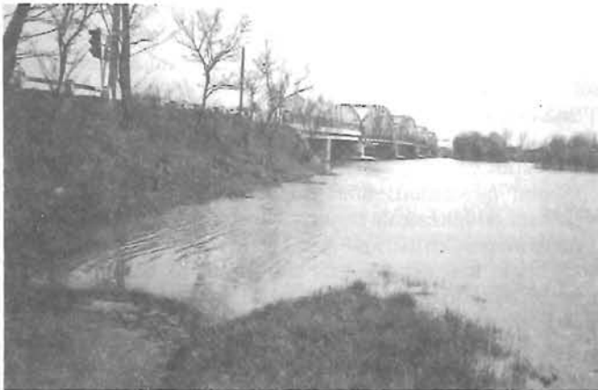
Árvízhelyzet a gyomai Körös-hídnál

A vezetékies ivóvizet természetesen nem érte semmiféle fertőzés. Jelenleg a hálózat mosatása folyik. Ezért egyes területeken tapasztalható volt zavaros víz, vagy magasabb klórszint. Ez csak egy megelőző intézkedés. -B-