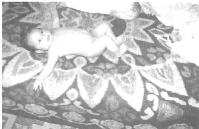
„Enyém az egész világ!”