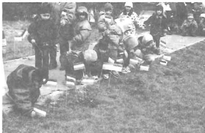
A Selyem úti óvoda gyermekcsoportjai előkészítik kis zászlóikkal az endrődi emlékmű környezetét az ünnepre