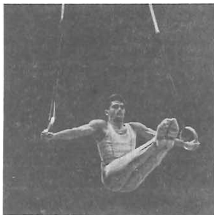
A Képes Sport 1959. május 19-i számából Budapest–Rastatt (NSZK) 283.70:275.55 városok közötti tornaviadal