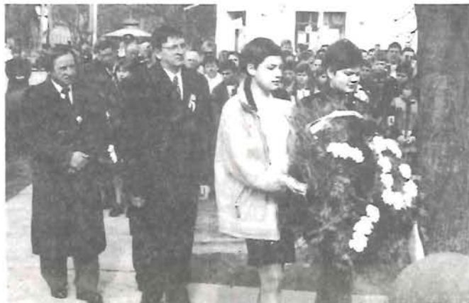
A Békés megyei közgyűlés elnöke koszorúz a Szabadság téren 14-én