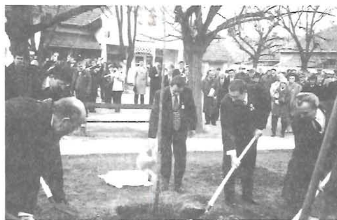
Az emléktábla ültetése a Kner emlékhárfasoron 14-én

15-én az endrődi városrészen folytatódott az ünnepség a katolikus templomban, majd koszorúzással ért véget.