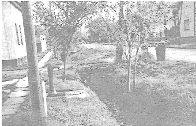
... és rendezés után az Árpád utcában