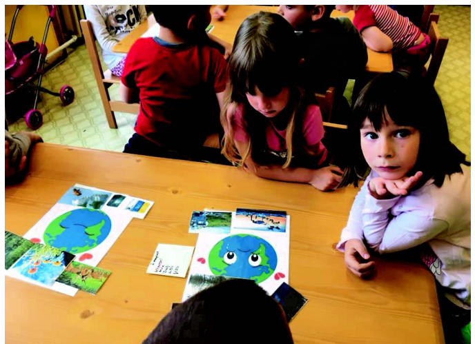
Egészséges táplálkozás, környezetvédelmi vetélkedő