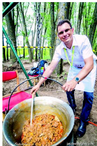
A Hagymányok hétvégéjén

Az ötezer fő alatti települések fejlesztésére készült a Kormány falufejlesztő programja. Boldogháza számára milyen lehetőségeket nyújt?