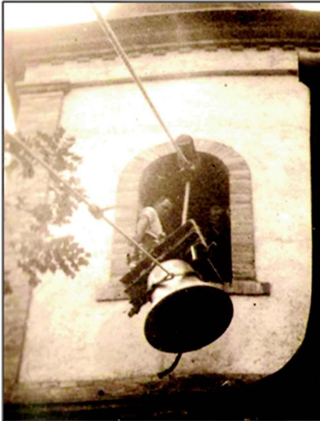
A harang beemelése a toronyba

csengő-bongó hangja gyönyörű szépen hangzott megszire a környéken. Az évek, sőt évtizedek múlásával egyre inkább különös érzés fogott el, amikor a szüleimhez hazalátogattam, és ennek a harangnak a hangját meghallottam. Mindig úgy éreztem, hogy valami kö-zünk van egymáshoz. Ilyenkor gyakorta eszembe jutott az a közismert mondás, hogy „A harang az élőket hívja, a holtakat siratja, a villámokat oszlatja.” Ennek a harangnak a hangja remélhetőleg még sokáig fog szólni, s mint ahogyan eddig, ezután is sok ember lelkét megérinti majd.”