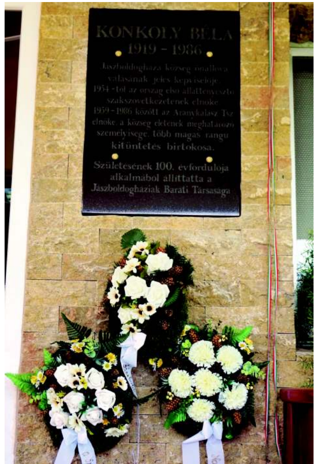
Emléktábla a Tsz iroda falán