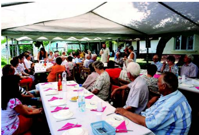
Ebéd a Tájháznál