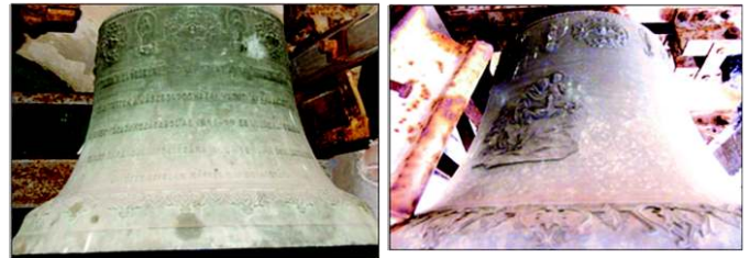
A vasutasok harangjának két oldala

A vasutasok harangját Slezák Ráfael öntötte. Egyik oldalán a felirat a harang rövid történetét írja le, másik