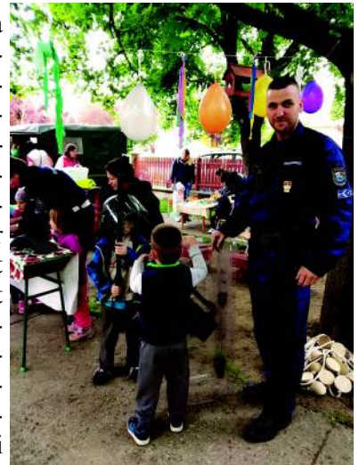
Rendőrségi felszerelések kipróbálása a gyermeknapon