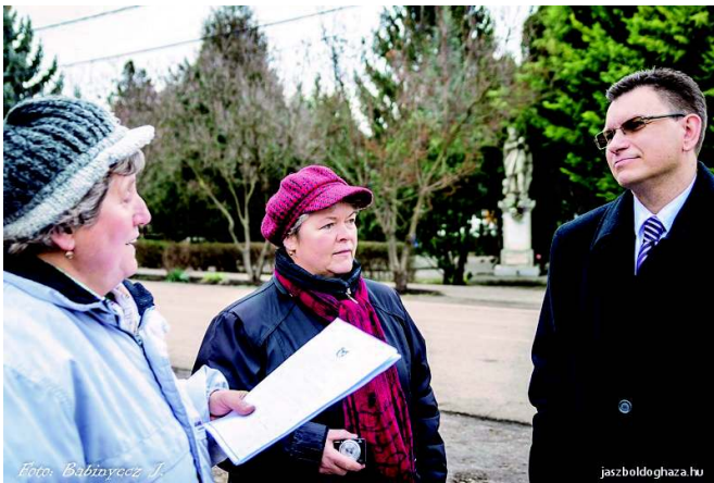
Beszélgetés a faluszépítővel

Nagyon sokat kell dolgozni a közterületek rendben tartásán és szépítésén. Ezt lehetőségeink szerint végezzük, a cél és a szándék nem kérdés sem az önkormányzat, sem a lakosság, sem a Faluvédő és Szépítő Egyesület részéről, akik nagyon sokat tesznek a környezetünkért. Örülök, hogy ezt ebben az évben, az egyesület 20. évfordulóján Jászboldogháza Községért díjjal is elismerte a testület. El kell ismernünk a közfoglalkoztatási programok hasznát is ezen a téren, nélkülük nem lennének ilyen gondozott és rendezett települések.