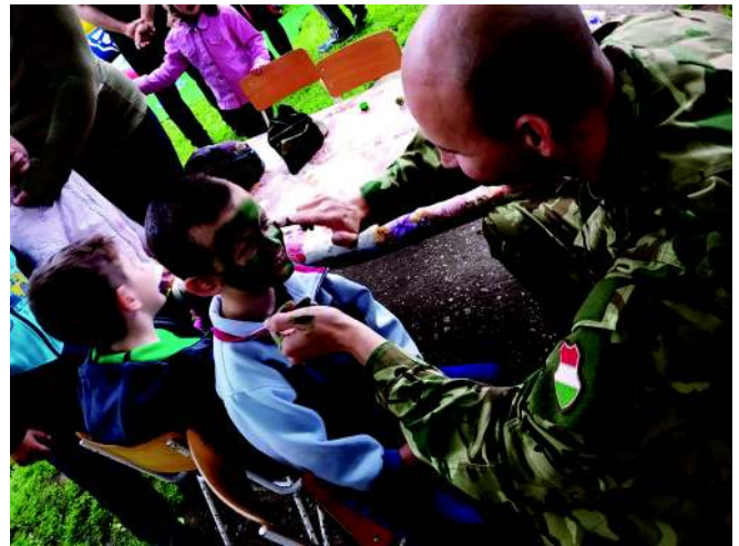
Katonai arcfestés a gyermeknapon