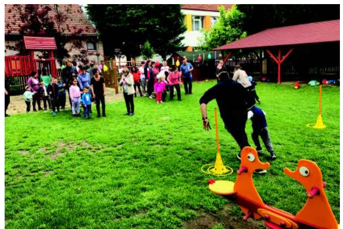
Sportverseny a gyermeknapon