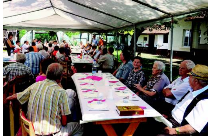
Ebéd a Tájháznál