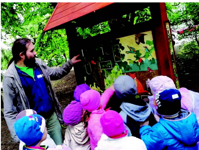
Kirándulás Tápiószelére a Növényi Diverzitás Központba

Május utolsó hetében „ Egészségünk és környezetünk védelme ” projekthét megvalósítása volt a cél. Ezen a héten a gyermekek ismeretterjesztő kisfilm, képeskönyvek segítségével megismerkedhettek azzal, hogy milyen módon védhetjük környezetünket. Az óvodán belül a középső- és nagycsoportos gyermekeknek környezetvédelmi vetélkedőt szerveztünk, ahol különböző feladatokat kellett teljesíteniük. Szelektíven válogatták a hulladékokat, egészséges és egészségtelen ételeket csoportosítottak, és olyan képekkel találkozhattak, amin a Föld bolygót károsító tényezők voltak jelen.