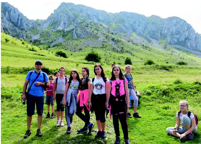
Erdélyi kiránduláson az iskolásokkal

Talán az egyik legfontosabb, hogy 5 éve elindítottuk a házi segítségnyújtást és szociális étkeztetést. Ennek keretében folyamatosan 25-30 fő kerül ellátásra, melyet nagyon kedvezményes térítési díj ellenében vehetnek igénybe a nyugdíjas lakosok, mivel normatív finanszírozást is kapunk hozzá. Jelenleg előkészítés alatt van egy pályázat, mely további szolgáltatás beindítását tervezi megvalósítani. Évek óta kérésként fogalmazódik meg a nyugdíjas napközi otthon létesítése, ezért terveink között szerepel ennek a megvalósítása. Itt kiemelném, hogy 4 éve került átadásra Jászboldogházán az új Mentőállomás, mely nagyon sokat javított a település egészségügyi ellátásán, ez elsősorban szintén az idősebb korosztálynak nyújt nagyobb biztonságot!