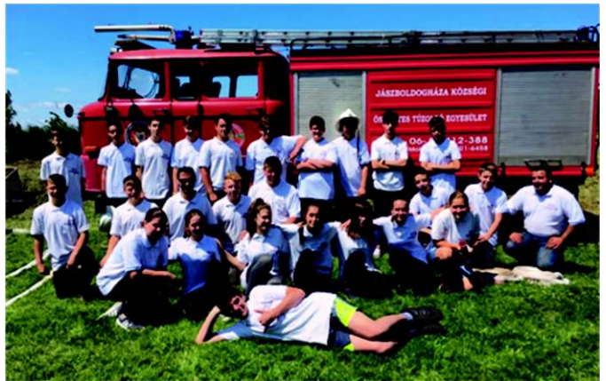
A jászboldogházi versenyzők

Köszönjük a rendezvény megszervezésében, lebonyolításában részt vevő, támogató, segítő cégeknek, magánszemélyeknek, szervezeteknek a támogatását, személyes közreműködését, munkáját! A verseny megszervezésében és lebonyolításában közreműködött a Jász-Nagykun-Szolnok Megyei Tűzoltók Szövetsége, a Jász-Nagykun-Szolnok Megyei Katasztrófavédelmi Igazga-