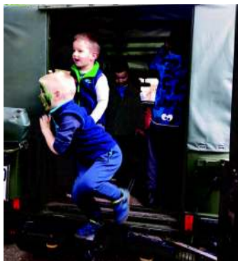
Katonai autóban a gyermeknapon

Mindezek mellett különböző kézműves tevékenységek közül választhattak a gyerekek, valamint arcfestést és csillámtetoválást is