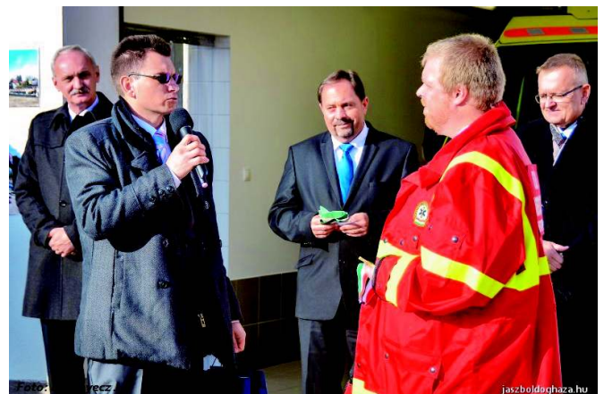
A mentőállomás átadásán