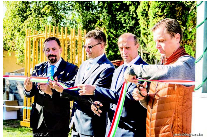
Az iskolai műfüves pálya átadásán

A sportolási lehetőségek körét szélesíti a Klebelsberg Központ által épített műfüves focipálya is.