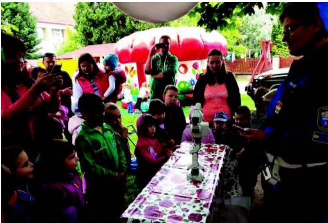
Rendőrrobot a gyermeknapon

A rendőrök bemutattak egy rendőrrobotot a gyermekeknek, amely mozgásra ösztönözte őket, hiszen a robottal együtt végezhetek különböző mozgásformákat. Nagy örömmel vett részt mindenki a robot által tartott mozgásban.