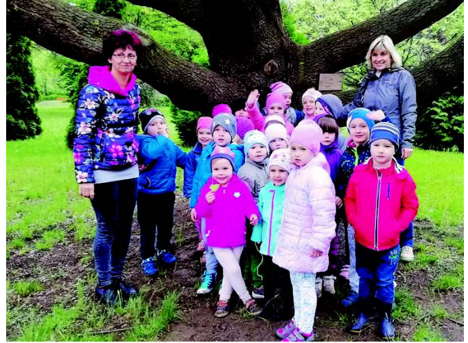
A Maci csoport a Növényi Diverzitás Központban

Így tettünk a „ Madarak és fák napja ” projekthéten is. A gyermekekkel hét elején megfigyeltük az óvoda szomszédságában fészkelő gólyákat és fecskéket. Távcső segítségével közelről tekinthették meg őket és fészkeiket is. Ismeretterjesztő kisfilmet is néztünk a madarak vonulásáról, életmódjukról, és hallhatták az egyes madarak hangjait is. Az óvoda udvarán bogárvizsgálóval különböző bogarakat is megvizsgáltunk, ezáltal újabb ismeretekhez jutottak a gyermekek. Igyekeztünk a hetet e téma köré építeni. Természettel kapcsolatos irodalmi, vizuális és zenei élményekhez juttattuk a gyermekeket. Élményszerző séták mellett kiránduláson is részt vettünk. Ellátogattunk Tápiószelére a Növényi Diverzitás Központba, ahol a növények sokféleségét mutatták be nekünk. Megismerkedhettek azzal, hogy mivel is foglalkozik egy génbank, milyen munkafolyamatok zajlanak. Sok új élményhez juthattak a botanikus kertben tett séták során is, ahol különböző növényeket vizsgálhattak meg közvetlen közelről. A séta után játékos foglalkozáson vettünk részt, ahol a „Magtól magig” című kiállítás játékos elemei segítettek a gyermekeknek megismerni, megtapasztalni a génbank által ellátott feladatokat. A gyermekek saját ma-