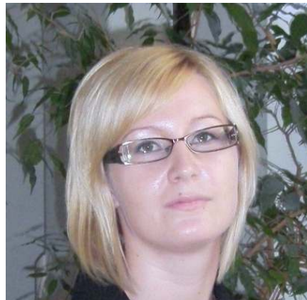
Jászboldogháza új jegyzője