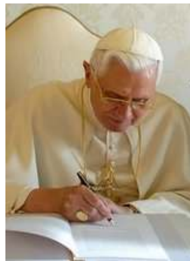
Megjelent XVI. Benedek pápa harmadik enciklikája

Pápasága ötödik évében, Szent Péter és Pál apostolok ünnepére dátumozva megjelent XVI. Benedek pápa Caritas in veritate kezdetű szociális enciklikája, amelyben a Szentatya a jelenkor társadalmát érintő legalapvetőbb szociális kérdéseket vizsgálja „az igazságban való szeretet fényében”.