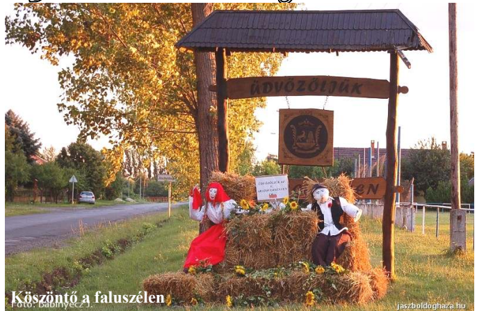
Köszöntő a faluszélen

Az arató brigádok 11-én reggel folyamatosan érkeztek, kik lovaskocsival (Jászberényből), kik busszal vagy személykocsival. A kezdés időpontjáig 17 csapat regisztráltatta magát. A három kerület még ennyi csapatot soha nem állított ki. Kiskunfélegyházáról 4, Kunhegyesről 3, Kunmadarasról 2, Kisújszállásról, Kunszentmártonból 1-1 aratócsapat nevezett. Jászberényt, Jászboldogházát, 2-2 csapat,