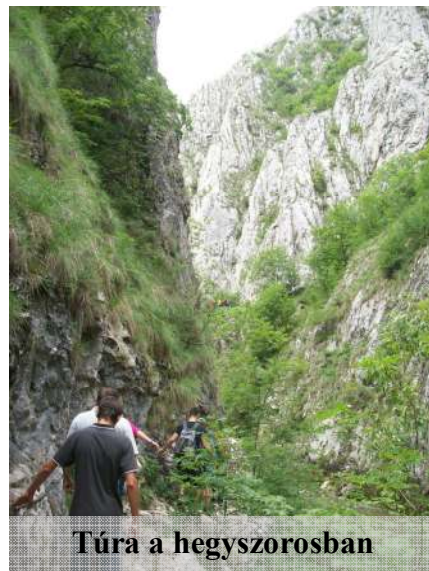
Túra a hegyszorosban

A harmadik napon nagyon korán keltünk, mert 3 órás volt az út Szovátaig. Itt elmentünk a Nagymedve tóhoz, ahol meg is fürödtünk. Ennek a tónak az a különlegessége, hogy olyan magas a sótartalma, mint a tengervíznek. 2 méter mély víz felett sem kell úszógumi, mert a sós vízben nem merülünk el. Külön érdekesség, hogy mint minden nap, aznap is kiküldték néhány órára a fürdőzőket a tóból, a só leülepedése érdekében. Erre figyelmeztető csengetéssel hívják fel a fürdőzők