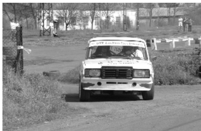
Május 1. Az autós verseny