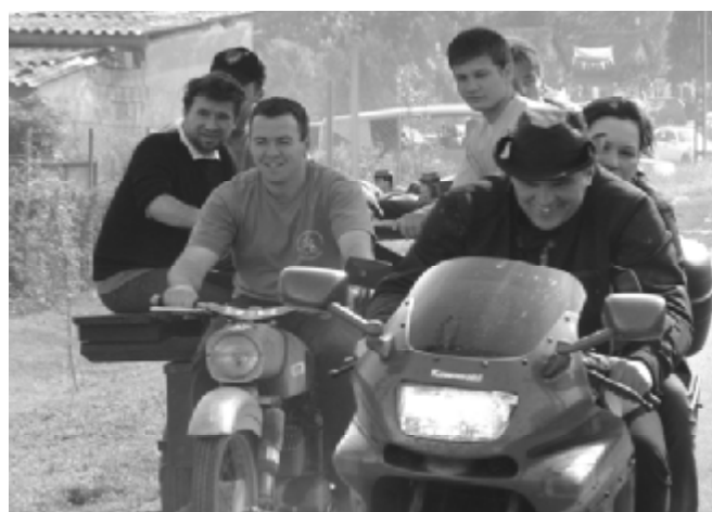
Motoros találkozó: A felvonulás