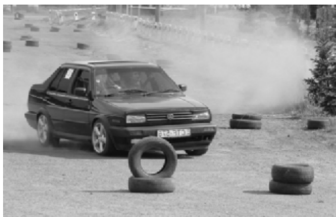
Május 1. Az autós verseny