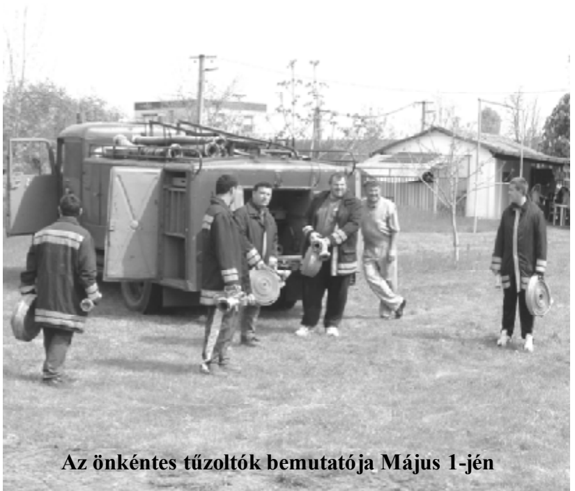
Az önkéntes tűzoltók bemutatója Május 1-jén