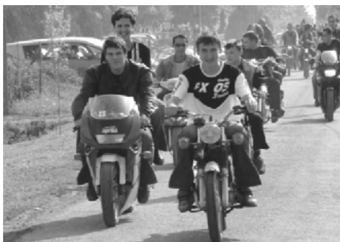
Motoros találkozó: A felvonulás