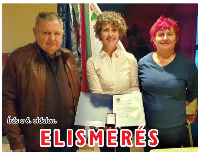
Írás a 6. oldalon.