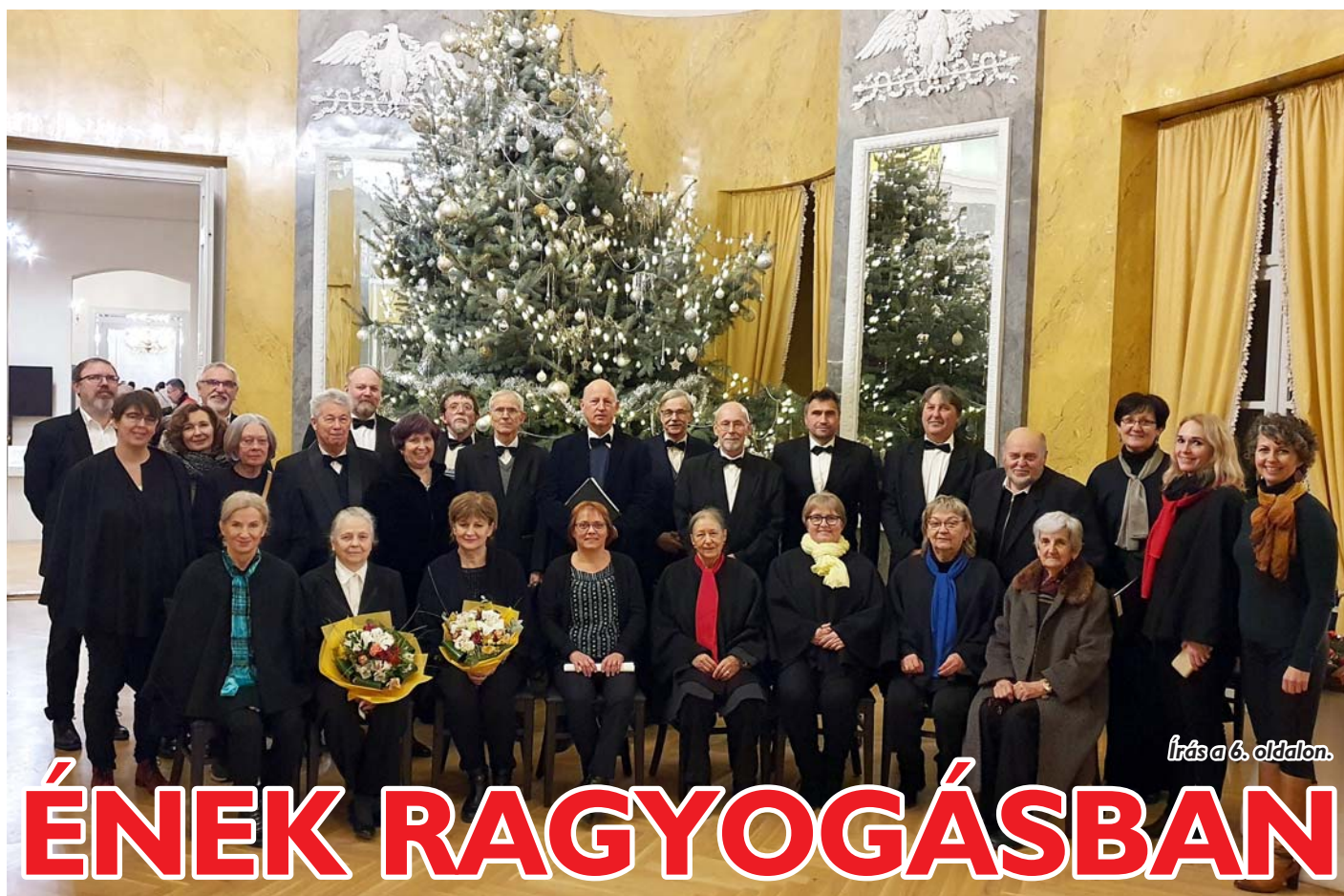
Írás a 6. oldalon.