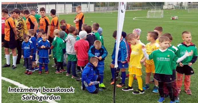
Intézményi bozsikosok Sárbogárdon