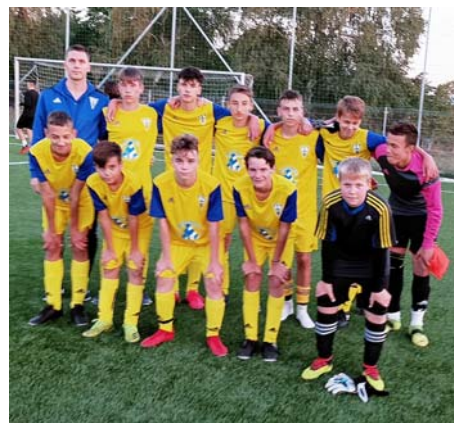
U15: A Kinizsit legyőzők