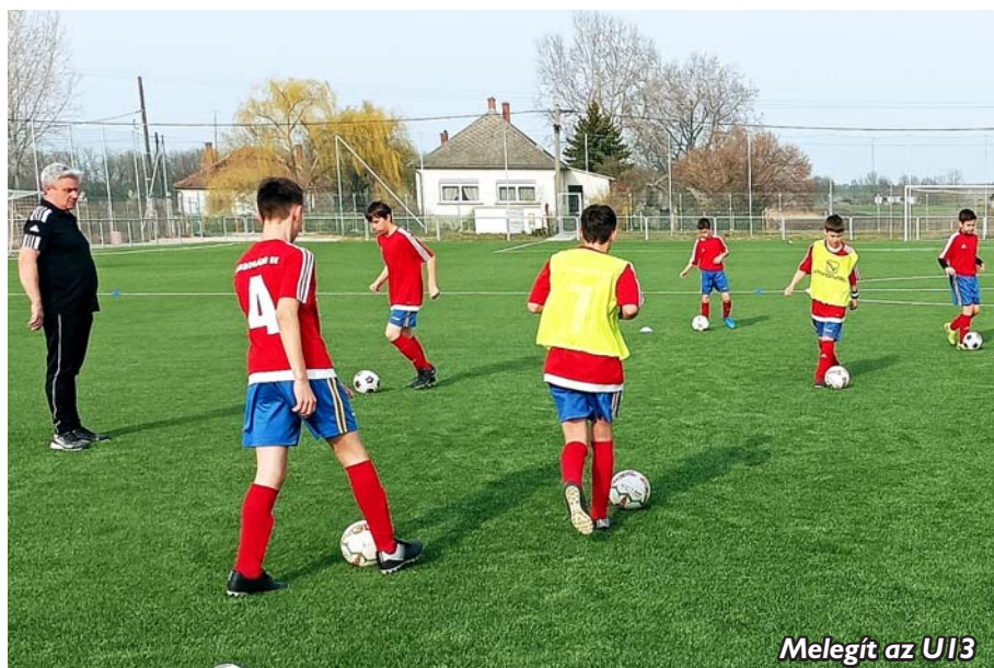
Melegít az U13