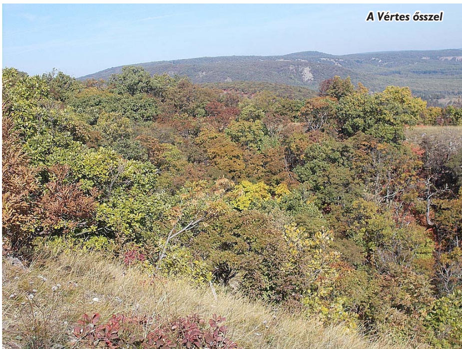
A Vértés ősszel

Amikor a püspök a levelet megértette, nagy sietséggel Németországba menekült. A császár ezalatt hiába várta, hogy a hajókról élelmiszert kapjon, pedig a sereget már éhínség fenyegette. Ezenfelül a besenyők és a magyarok éjszakáról éjszakára minden módon zaklatták a németeket. Mérgezett nyilakkal lőtték rájuk és pányvával fogdosták el azokat, akik a sátrak között