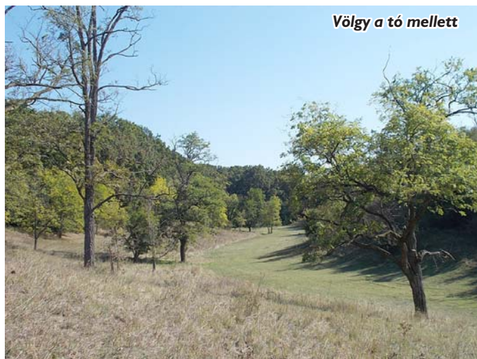
Völgy a tó mellett

A horgászó környezete étellel telt meg. Vasárnap lévén sok család kitelepült a tó partján lévő faházakhoz, stégekhez. A felnőttek főztek, jó étvágyal ettek, mosolyogtak, nevettek, a gyerekek fel szabadultak, de nem hangosan örültek az életnek. Ez természetes is ilyen szép környezetben. A tó környéke szépen karbantartott, látszik, hogy vigyáznak rá. A tó egy völgyben fekszik, körülötte lankás dombok, ahol gyakran elhalad a Budapestre menő vonat. Aki ezen a tájon kinéz a vonat ablakból, azt biztosan megragadja a Piroska-tó látványa. Mivel nem járható teljesen körbe a tó, azt a javaslatot kaptuk, hogy a dombon lévő, messziről látható fehér padhoz tartunk, mert ott a legszebb a kilátás. A stégen horgászó férfiak barátságos pillantást vetettek ránk és előre köszöntek. Volt, aki megkérdezte, horgászni jöttünk-e. A „nem” válaszunk után jó pihenést kívántak nekünk. Egymásra néztünk a barátnómmal. Kisszékely, Lajoskomárom után itt, Nagylókon is ilyen barátságosak az emberek? Az erdő által kísért úton haladtunk úti célunk, a fehér pad irányába. Mikor a dombra felérve letáboroztunk, és a padon megpihelve ránéztünk a tóra, csodálatos lát-