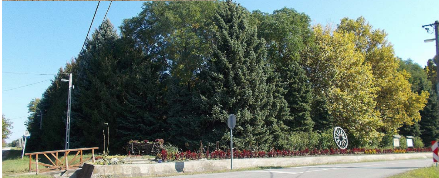
Zöld oázis a főútcán