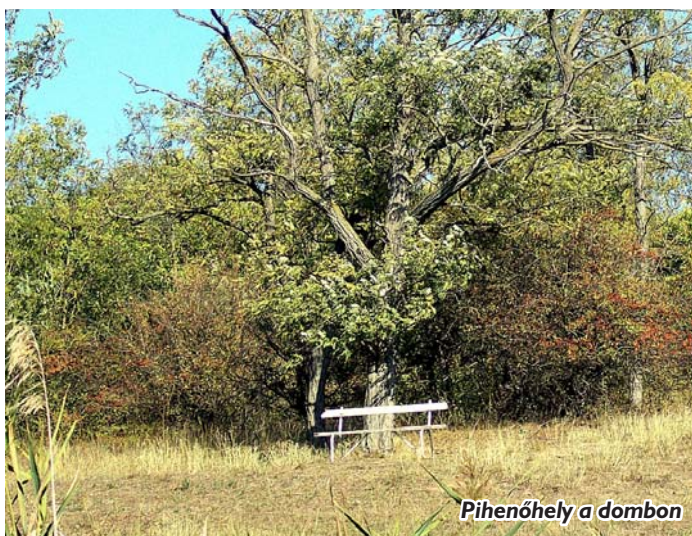
Pihenőhely a dombon

Ebben a festői környezetben most nem volt kedvünk mozdulni, csak szívtuk magunkba a látványt, az oxigéntől dús levegőt, a csipkebokrok piros lángolását, a nap melegét. Sárbogárdtól 15 km-re mi a Riviérán éreztük magunkat. Azt gondolják, hogy ez túlzás? Ki kell próbálni! A nagylóki Piroska-tó elérhető mindenki számára. A nagylókiak nem sajnálják tőlünk, vendégszerető népek. A vendégnek viszont illik tekintettel lenni a horgászok nyugalma és a környezet tisztaságára, mert ez így kölcsönös.