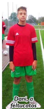
Dani, a féltucatos