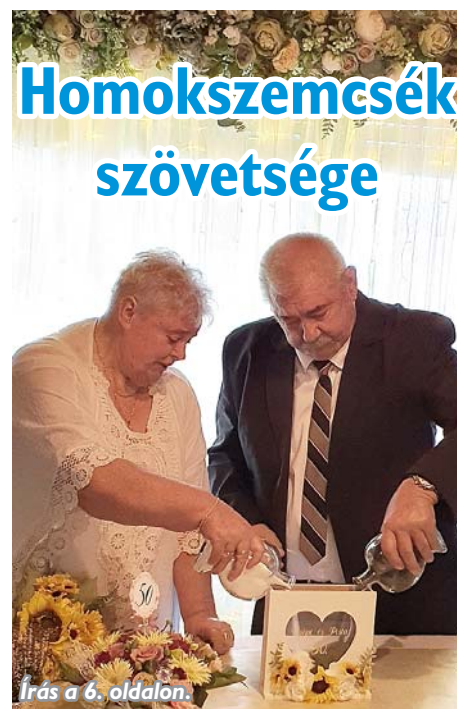
Írás a 6. oldalon.