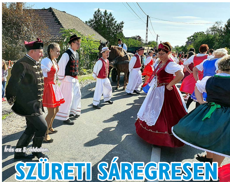
Írás az 5. oldalon.

Királyi kék ék Az őszi bordó-sárga-zöld színei közt egy kék is virít frekvenciált helyet foglalva el a város forgalmas szívében. A kék ékesség nagy népszerűséget élvez azok körében, akiknek sárgán virágozik a tök és lassan dőcögnek hazafelé, vagy akiket a Mars nevű bolygó hatása gyötör. Mindemellett a város fő verőerén áthaladók és a buszmegállóban ácsorgók élő, egyenes adásban tekinthetik meg a kék trónnal zajló valóságshow aktuális epizódjait, stopperrel mérhetik, ki meddig élvezi a Toi-Roi, azaz a mobilvéde királya címet az egyszemélyes birodalomban, mely állam az államban – ha nem is épp fenséges, ám mindenképpen középkorhoz hű körülmények és „illatok” közt. Kértek pár tő levendulát ültetni az intézmény köré! Hargitai-Kiss Virág