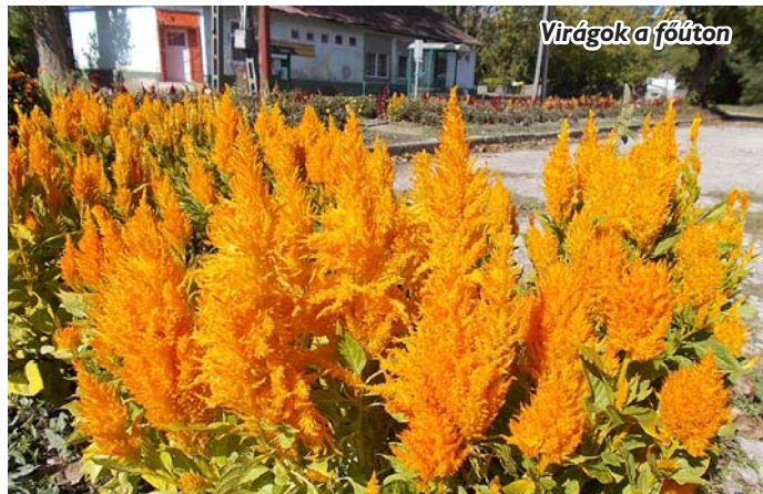
Virágok a főúton

Sokszor hallottam Nagylókkal kapcsolatban a Piroska-tó nevét. Már csak a név is kíváncsivá tett. Egy szép napsütéses hétvégén indultunk terepszemlére Nagylók községbe. A kislóki útról lekanyarodva egyre zölddebb és egyre szebb lett a táj. Az utunkat szinte végigkísérte az erdősáv. Barátnóm, aki sokszor utazott át a településen, szomorúan mondta, hogy még ennél is több fa volt az út mentén régen, csak a szántóföldi művelés miatt kiirtották őket. Az erdőmajori rész vezetett be a településre bennünket. Rögtön a község elején található a Lóki-tó; meg kellett állnunk ott, mert olyan hívogató. Csak az országút felőli részén jártunk, mert beljebb már magánkézből van a tó. Nagyon szép látvány tárult elénk. Vadkacsák úszkáltak a vízen, csillogó víztükör, a parton sok időt megélt fák, melyek sok mindennek tanúi voltak az idők folyamán. A településbe érve rendezett utcakép, virágos porták fogadtak bennünket. A szép őszi napsütésben nem győztünk gyönyörködni az őszi virágok színpompájában. Kész színterápia! Olyan gyönyör-