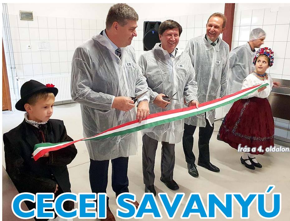
Írás a 4. oldalon.