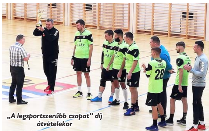
„A legsportszerűbb csapat” díj átvételekor