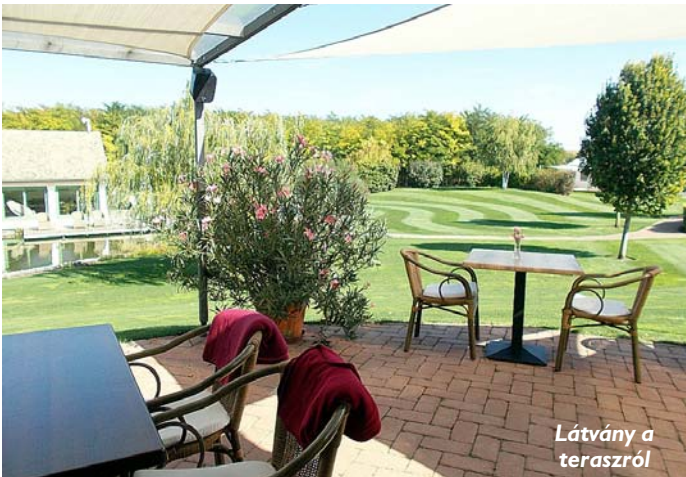
Látvány a teraszról

Sárbogárd környékének felfedezése során egy újabb gyöngyszemre akadtam. Lajoskomárom 2017 óta van a bakancslistámon. Ekkor olvastam róla kedvenc újságomban, a Nők Lapjában. Felfigyeltem a cikkeire, hisz egy Sárbogárdhoz közeli településről volt szó, pontosabban egy ott lévő vállalkozásról. A téma tovább növelte a kíváncsiságomat. Ugyanis a csendről, annak egészségjavító hatásáról szólt az írás. Ennek kapcsán mutatták be a lajoskomáromi Páskom nevű vendégházat, amely a csendre, a nyugalomra vágyó emberek számára létesült.