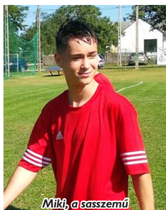
Miké, a sasszemű