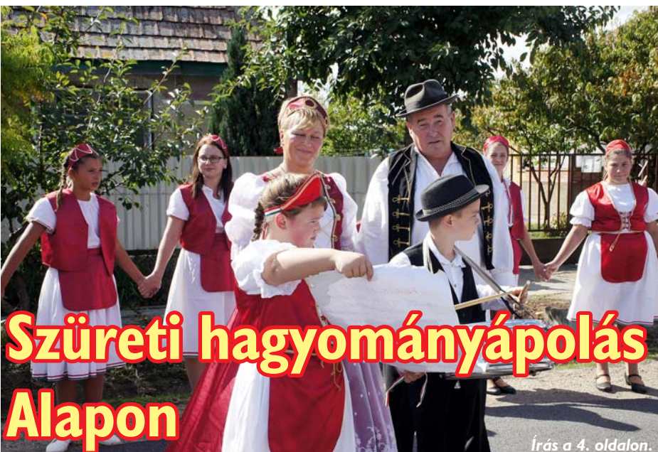
Írás a 4. oldalon.