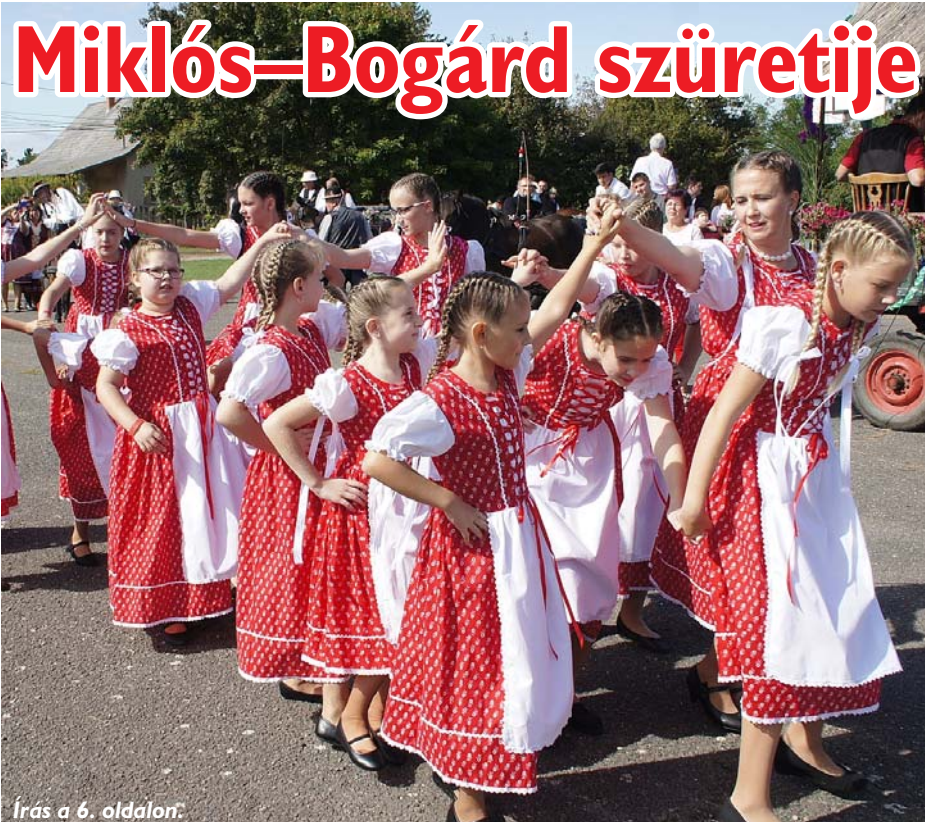
Írás a 6. oldalon.