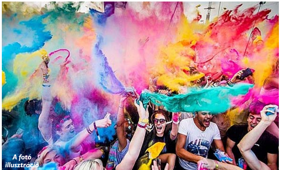
A foto illusztráció

Rossz időben a sátor sok esetben megfelelő menedék lehet, azonban figyelni kell arra, hogy ne olyan helyen állítsuk fel, ahol faágak eshetnek rá, vagy fák dőlhetnek ki. Baj esetén a menekülési útvonalakat követve hagyjuk el a hely-