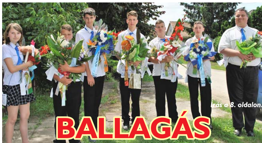
Írás a 8. oldalon.