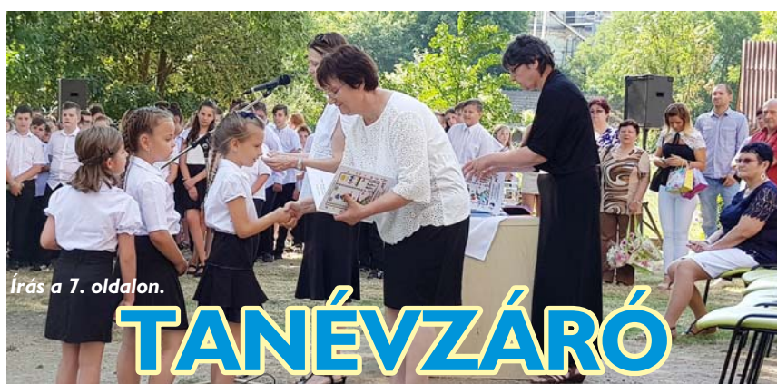
Írás a 7. oldalon.