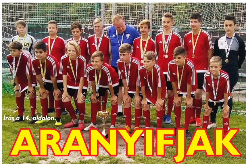
Írás a 14. oldalon.