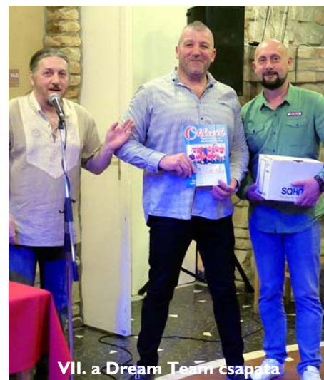
VII. a Dream Team csapata