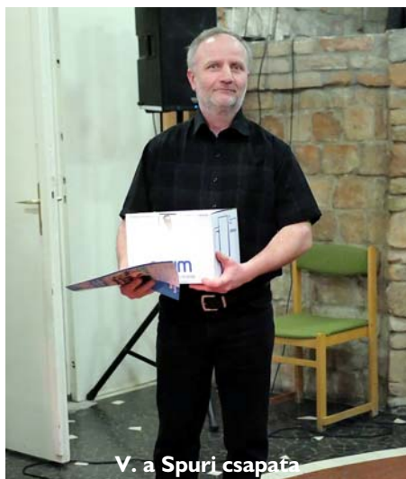
V. a Spuri csapata