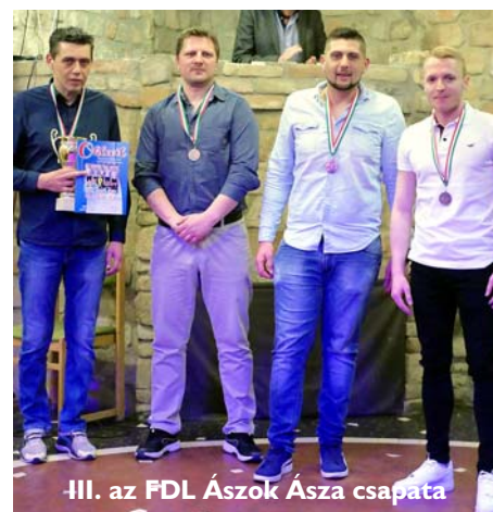
III. az FDL Ászok Ásza csapata