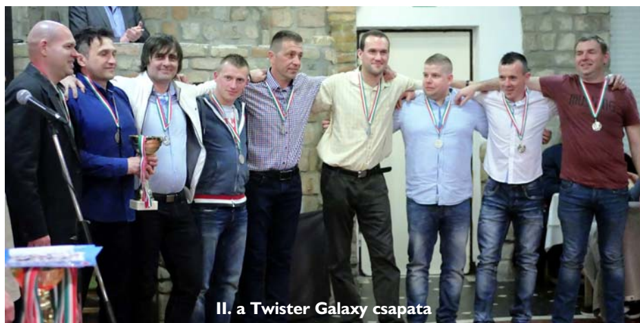
II. a Twister Galaxy csapata