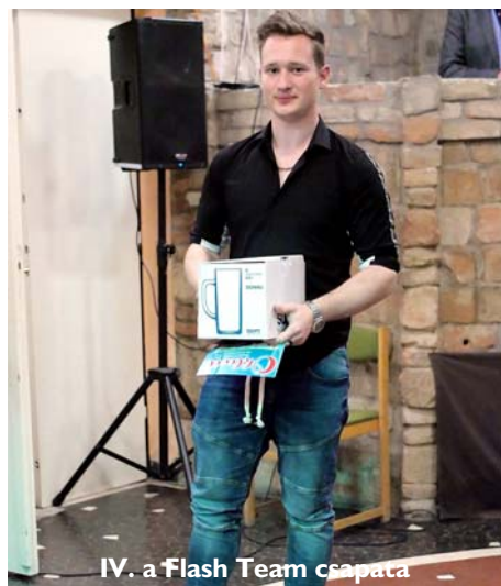
IV. a Flash Team csapata