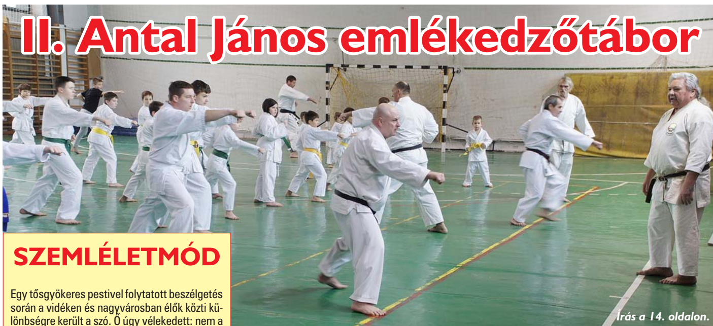
Írás a 14. oldalon.