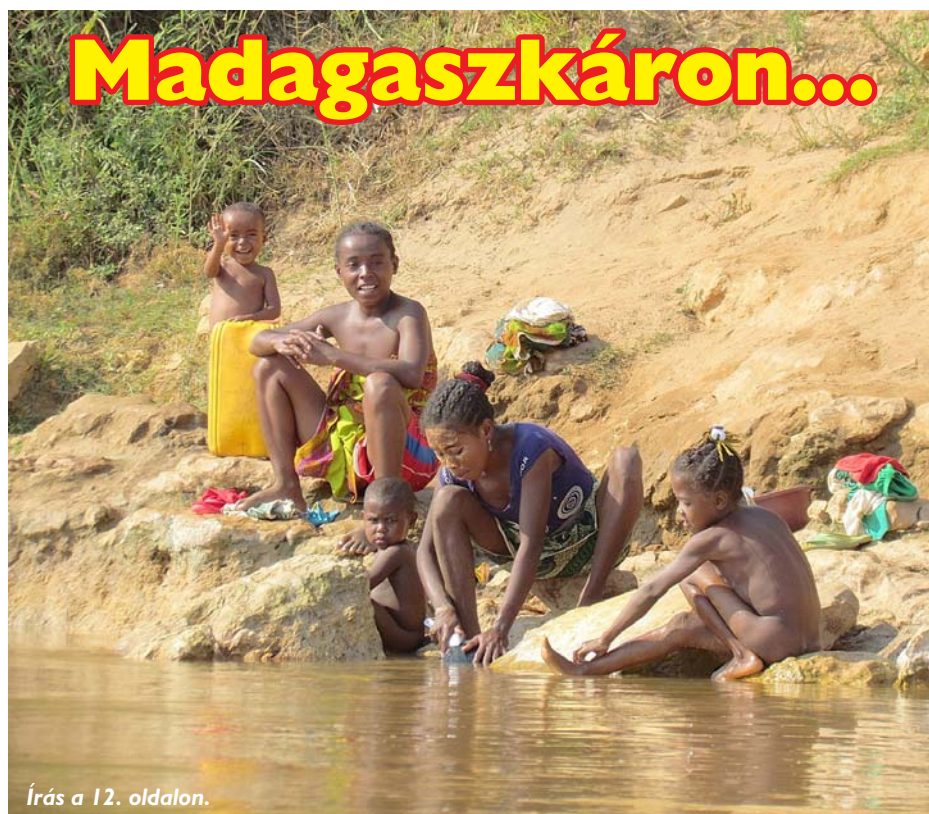
Írás a 12. oldalon.