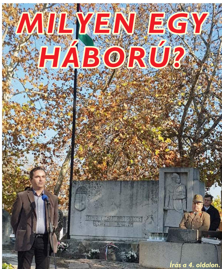
Írás a 4. oldalon.