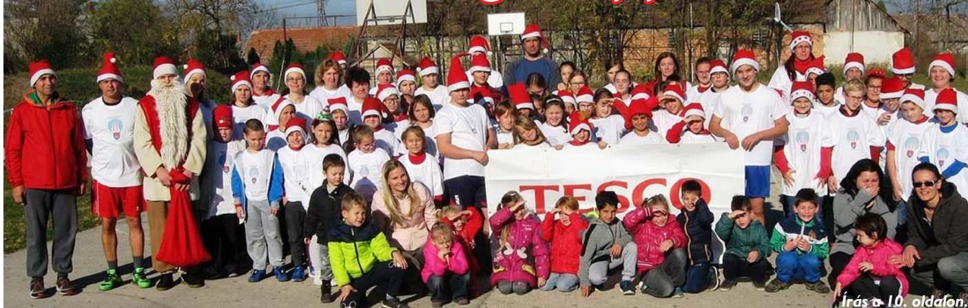
Írás a 10. oldalon.