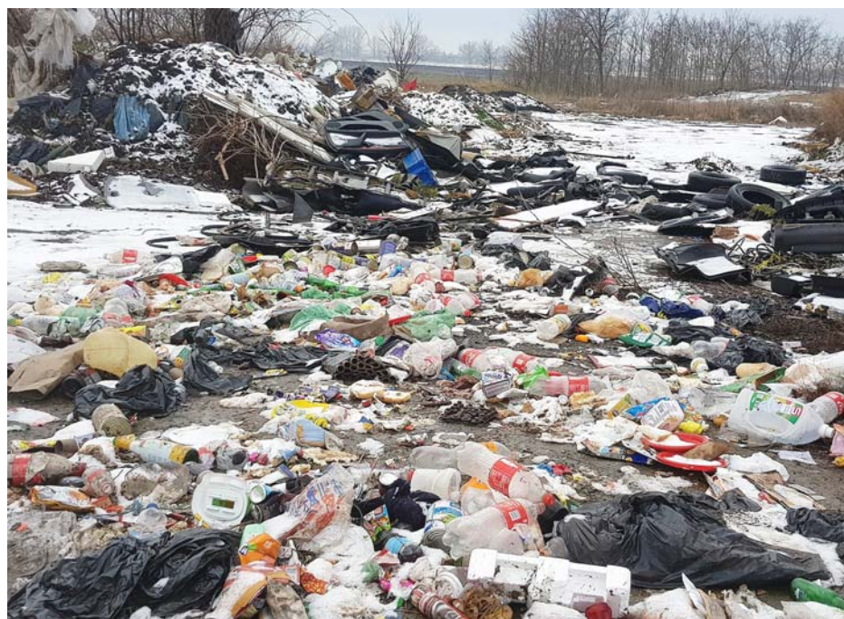
Ez a kép nem illusztráció, hanem a valóság!