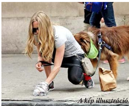
A kép illusztráció.