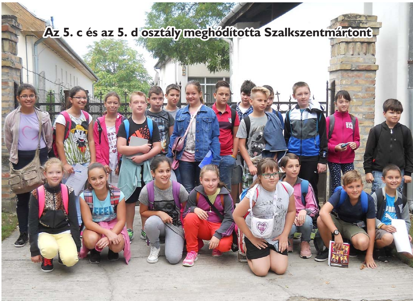
Az 5. c és az 5. d osztály meghódította Szalkszentmártont