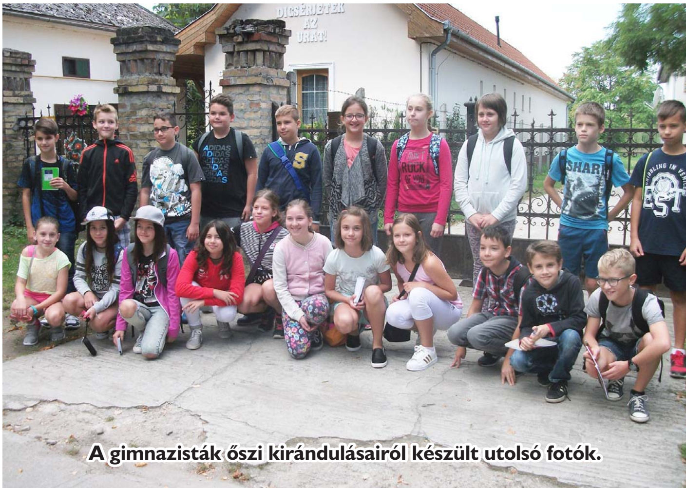
A gimnazisták őszi kirándulásairól készült utolsó fotók.