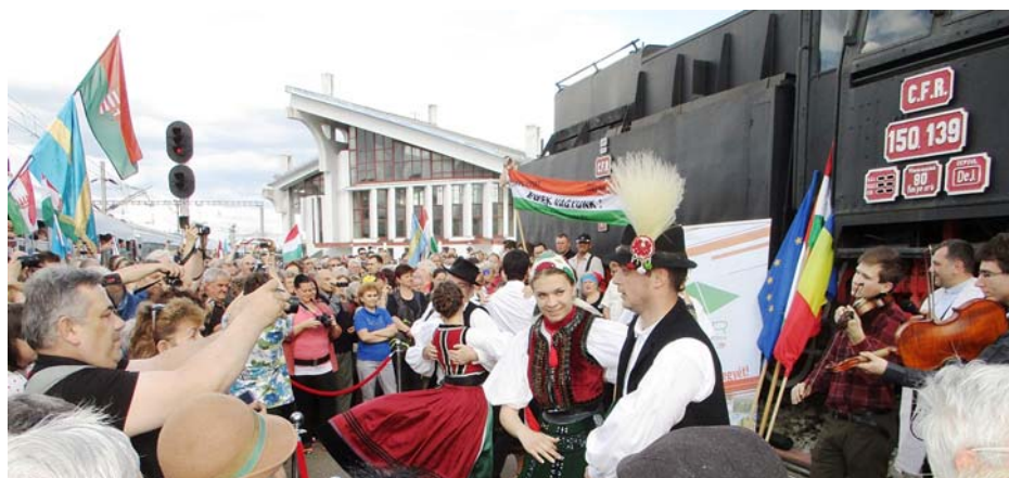
Kolozsváron zenészek és néptáncosok köszöntöttek bennünket

Ha magam meg nem tapasztalom, talán el sem hiszem.