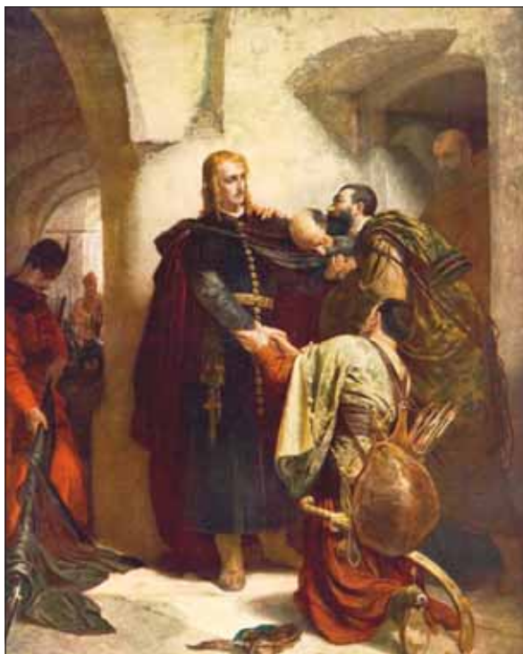
Benczúr Gyula: Hunyadi László búcsúja