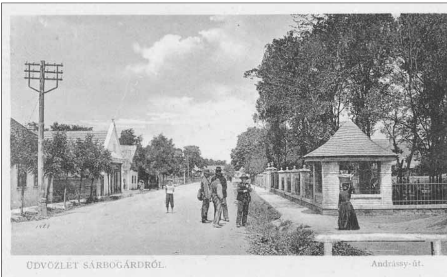
Korabeli sárbogárdi utcakép