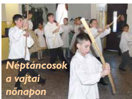
Néptáncosok a vajtai nőnapon