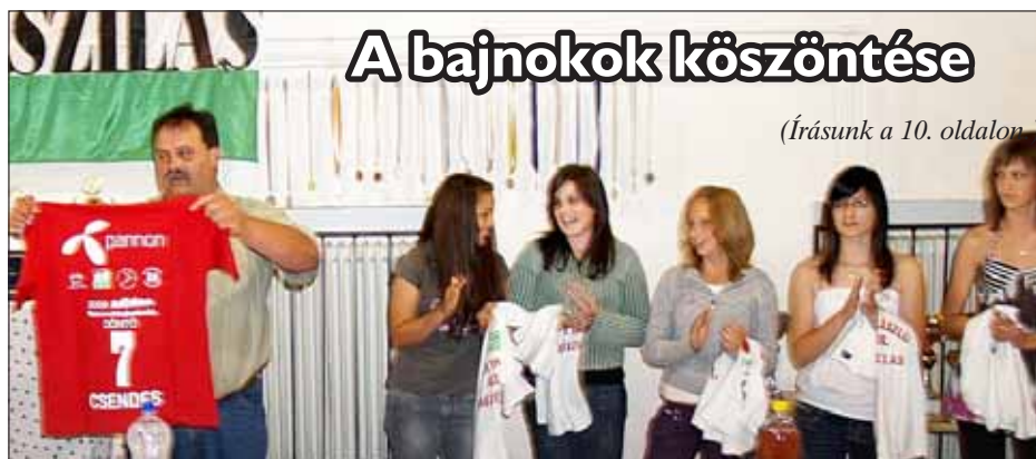
A bajnokok köszöntése