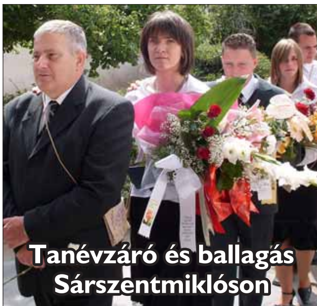
Tanérváró és ballagás Sárszentmiklóson