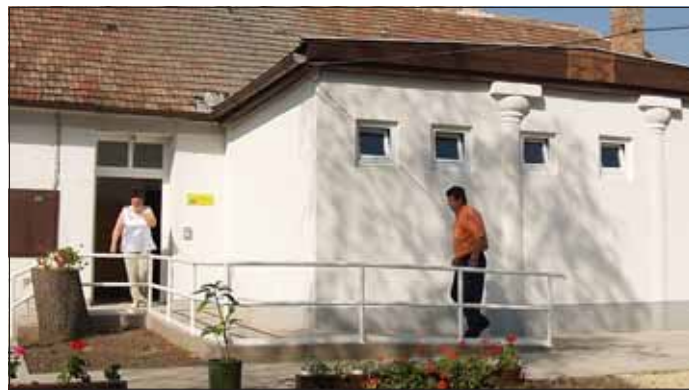
A kúria az átalakítás után

— Ez az épület egy régi kúria volt. Amint látom, ennek a klasszicista stílusú ámbitusa (fogadótere) lett befalazva, és itt alakítottak ki mellékhelyiségeket.