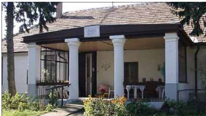
A kúria az átalakítás előtt