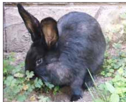
Nyuszó négylevelű lóherét keres...