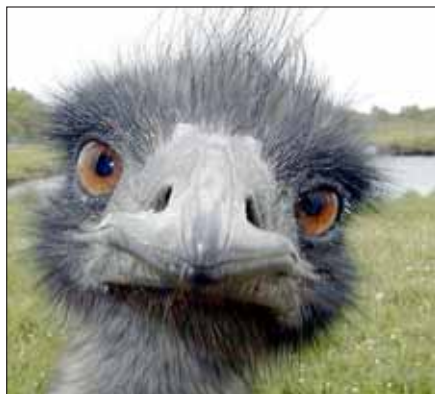
Én nem folytatok struccpolitikát!