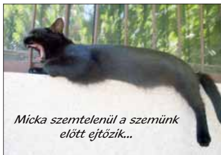
Micka szemtelenül a szemünk előtt ejtőzik...