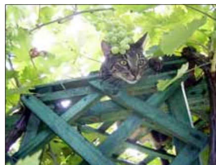
Marci római császárt játszik...