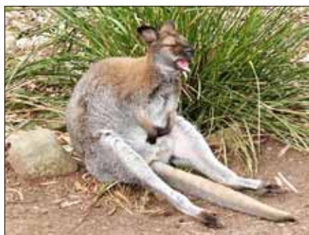
Áááá! Olyan fáradt vagyok, hogy még a saját farkamról sem vagyok képes leszállni!