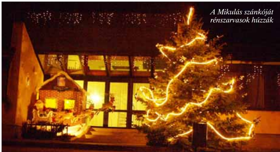
A Mikulás szánkóját rénszarvasok húzzák