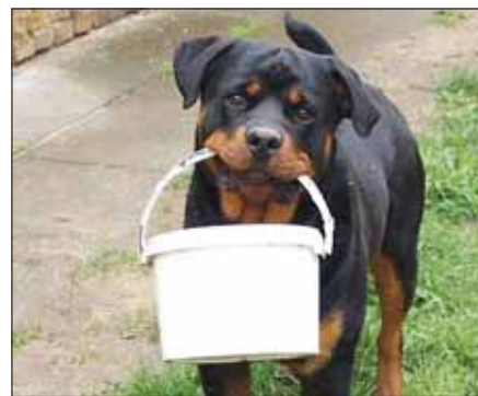
Szotyí tűzoltónak készül...