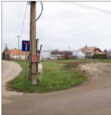
A leendő építmény helye

Amikor először fölmerült a templomkérdés, ösztönösen arra gondoltunk, hogy felújítjuk a számunkra oly fontos templomot. Ezért is indítottuk a gyűjtést, melynek köszönhetően 1,5 millió Ft jött össze. Ebből 1 millió 100 ezer Ft-ot a gyülekezet tagjai, 400 ezer Ft-ot a sárbogárdi és sárszentmiklósi lakók adományoztak. Szembesülnünk kellett azonban azzal is, hogy a templom a gyülekezeti ingatlanok problémakörének csak egy része; továbbra is megoldatlan marad a lelkészlakás és gyülekezeti terem ügye. Ha sok pénzünk lenne, mindháromat megoldanánk, de mivel nincs, fontossági sorrendet kellett felállítanunk. Volt egyébként olyan elképzelés is, hogy a miklósi templomot két szintre és helyiségekre osztanánk, és ott helyet kaphatna minden: kisebb templom, gyülekezeti terem, lelkészlakás — három az egyben. A gyülekezet többségének azonban nem tetszett a gondolat, és építészeti aggályok is felmerültek. Ezért ezt elvetettük.