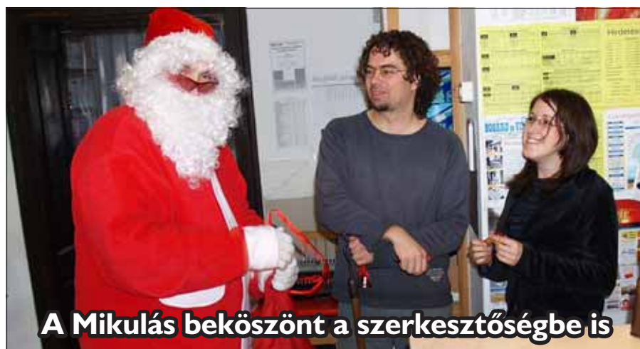
A Mikulás beköszönt a szerkesztőségbe is