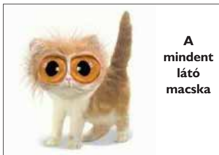
A mindent látó macska

Gratulálunk! Nyereményedet átveheted a szerkesztőségben!