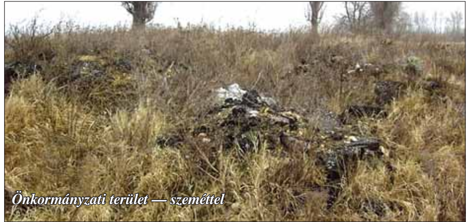
Önkormányzati terület — szeméttel