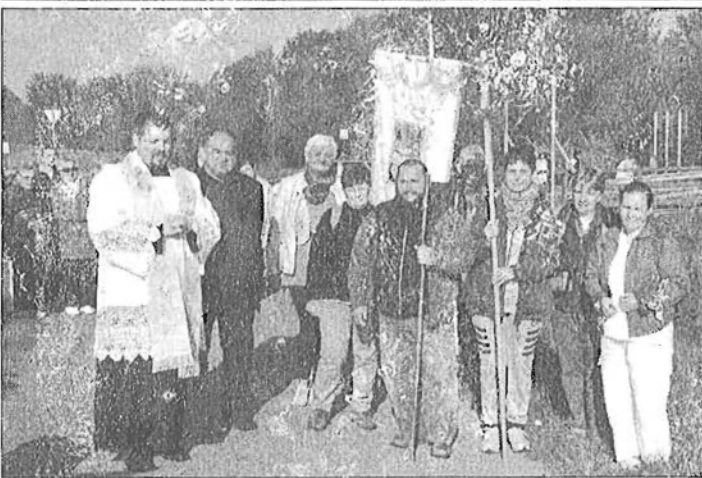
Április 30-án elindultak Endrődről Nagyváradra a gyalogos zarándokok